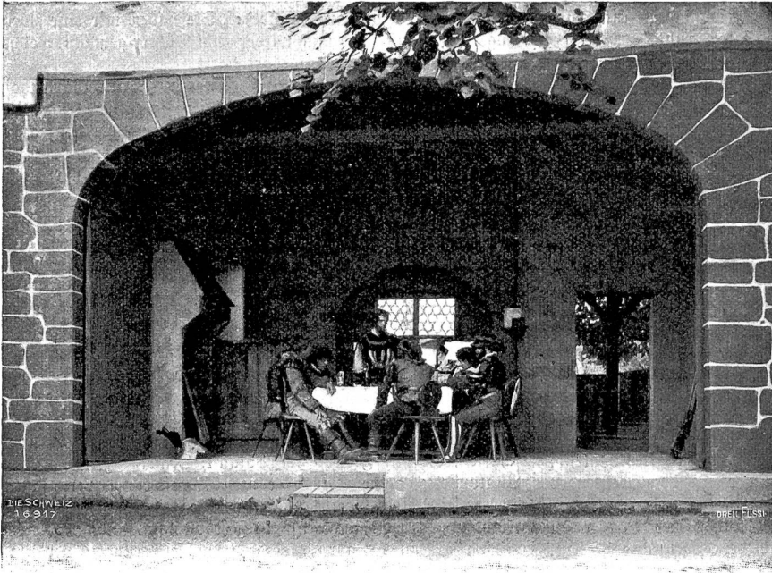
Goethes Götze von Berlichingen in Dießenhofen. Mahlzelt auf der Burg Jagthausen (Bühne links).

buchblätter, die in kurzen Zügen einen Einblick in das Geistesleben des Mannes gestatten, der aus tiefster Seele von sich selbst sagen konnte, was er einer seiner Dichtergestalten in den Mund legt: