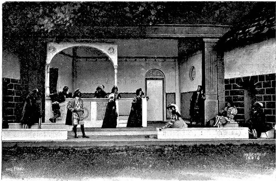
Goethes Götze von Berlichingen in Dießenhofen. Hoffzene mit Liebetraut im zweiten Akt (Mittelbühne).

Von Wieland, den der junge Goethe am Hofe von Weimar traf und den er bekanntlich in jugendlichem Uebermut beleidigt hatte, schrieb er 1770 an Erasmus Reich: „Nach Deser und Shakespeare ist Wieland noch der einzige, den ich für meinen echten Lehrer erkennen kann; andere hatten mir gezeigt, daß ich fehlte, diese zeigten mir, wie ich's besser machen sollte.“