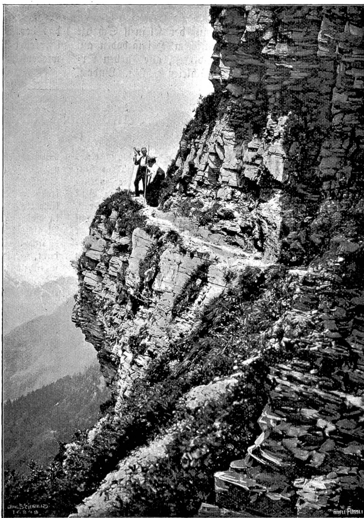
Vom Ristenpaß. Der „böse Tritt“.

Und im Regen fahren wir nach Bern, genießen dort