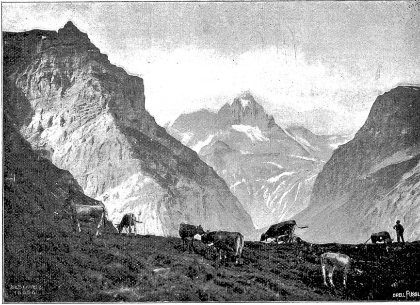
Vom Riltenspaß. Baumgartenalp.

noch einen letzten Sonnenblick auf der Kleinen Schanze und kamen im Regen auf deutschem Heimatboden an. Kalt, unfreundlich war die Landschaft, alle Farben verwischt, alles in graue nasse Schleier gehüllt, Lindau,