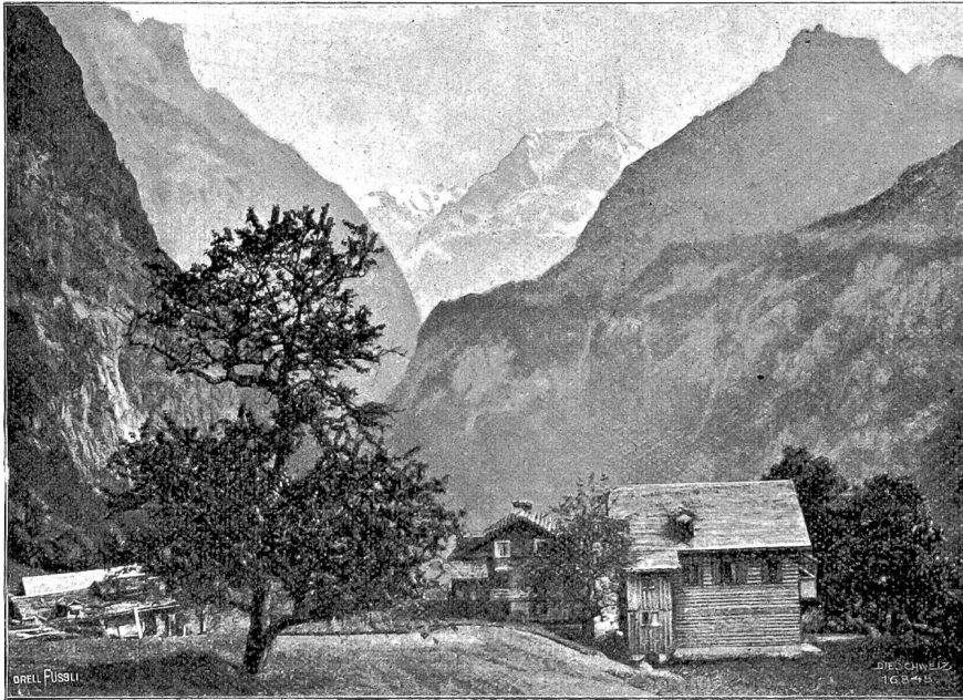
Vom Ristenpaß. Kurhaus Obort.

der Gießbach milchweiß durch die Felsenwüste. Vor uns steigt finster, fast schwarz der Hinterberg empor, an dessen Fuß sich die verlassene Sennhütte schmiegt. Gegen Osten wird die verschneite Spitze des Schwarzhorns sichtbar; leichte Nebel schweben um sie her. Rechts oben steht einsam, todesstarr die schroffe, mitten wie von Gigantenhand entzweigespaltene Similwand. Unsere Blicke messen die Höhe der Felsen zwischen ihr und dem Hinterberg, die wir ersteigen müssen, und verfolgen die schmalen Nasenbänder, über die wir in fortwährenden Kehren und Kletterpartien den Weg nehmen werden. Wir gedenken des herrlichen Sonntagmorgens, da wir den Plan unserer Faulhorntour hier faßten und selig im Grafe ruhten.