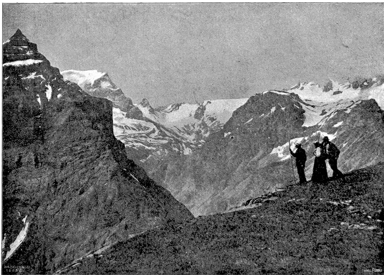
Vom Kistenpaß. Aussicht vom Nüschenegg auf Claribengruppe, Tödi und Hausershorn.