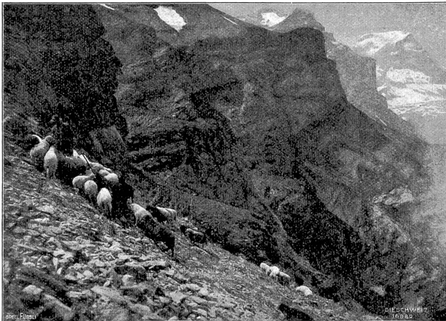
Vom Kistenpaß. Schafherde am Wasserpaß.

lieblich duftende Alpenveilchen pflückend, steigen wir frohgelaunt die steile Alp hinauf dem „Thor“ entgegen. Höllischer Durst hat dieser Marsch erzeugt: ein Glück, daß kaum einige hundert Meter entfernt die Wasserstation winkt, eine Quelle mit frischem klarem Quellwasser! Hier wird gerastet. Soeben zieht der Schäfer mit seiner Herde den Nüschenhörnern entlang: die nebenstehende Abbildung bietet die hübsche Szene, die sich da vor uns abspielte. Ausgeruht erreichen wir nach mühelosem Marsch in ständiger Führung mit der Schafherde das Nüschenegg. Von diesem Punkt aus gewährt der Gebirgskanton einen immensen Einblick in seine Schluchten und Täler, auf all seine imposanten Gipfel und Firnen, wie z. B. Selbsanft, Biserten, Tödi, Glariden usw. usw. In nächster Nähe an geschützter Stelle liegt die kleine Hütte des Schäfers; der Sammelpunkt auch für die