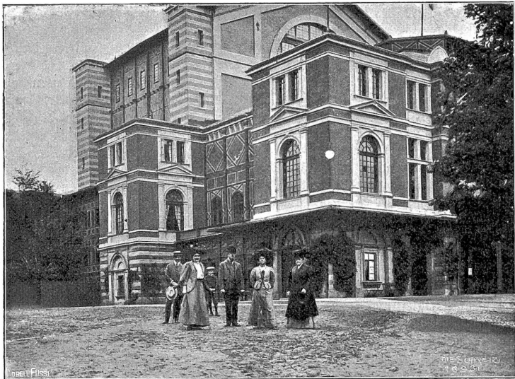
Festspielhaus zu Bayreuth.

Es wird den Lesern der „Schweiz“ nicht unlieb sein, den