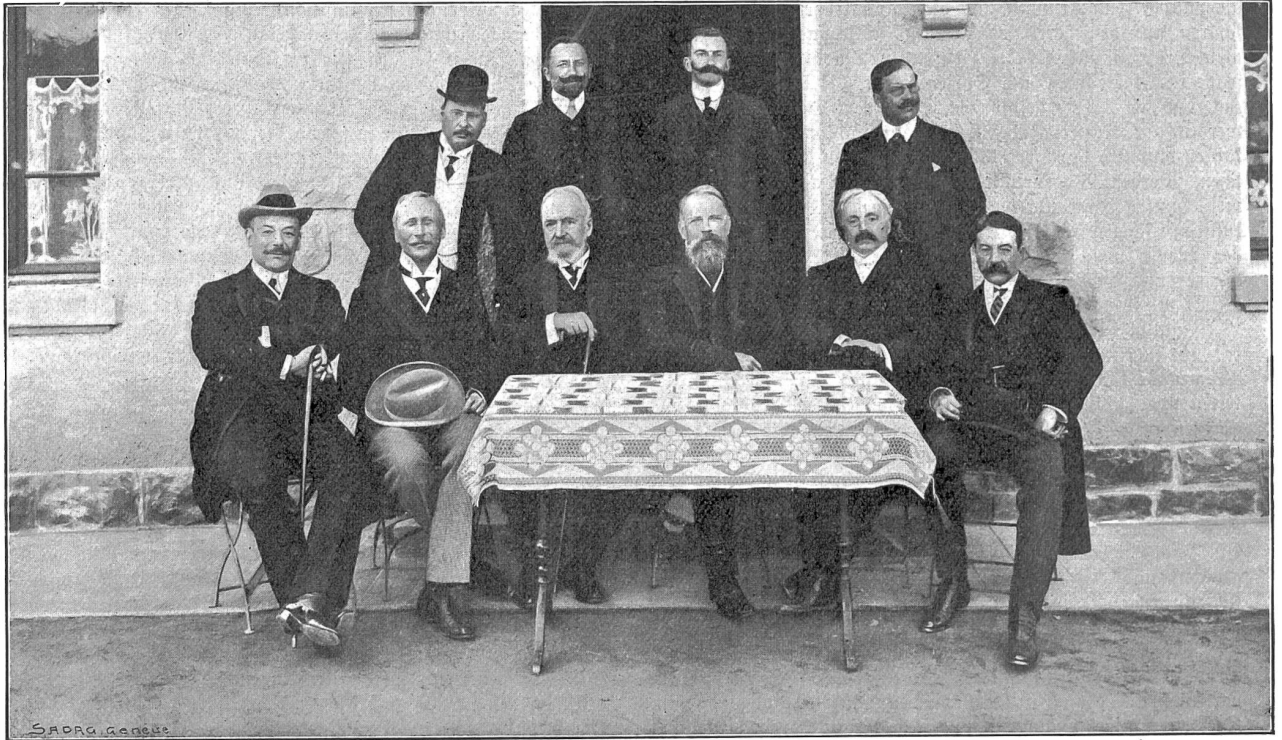
Die Vertreter der Schweiz. Eidgenossenschaft im Ausland bei ihrer Zusammenkunft zu Marly, Rt. Freiburg, am 19. Sept. 1908.