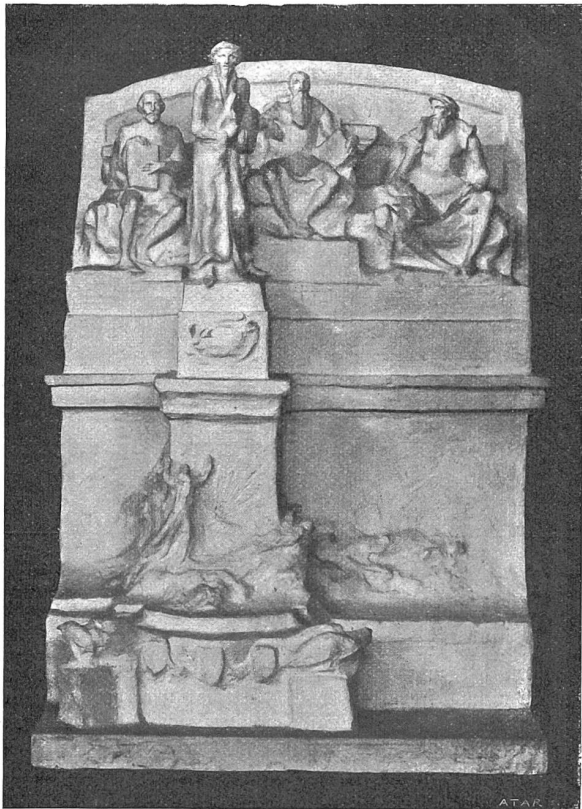
Vom Wettbewerb für das Genfer Reformationsdenkmal. Der mit einem dritten Preis ausgezeichnete Entwurf von Architekt Ch. Blumet, Gené (Frankreich), und Bildhauer Aug. de Niederhäusern-Rodo, Bern. — Phot. F. Dollmanns, Gené.

(1812). „Die alte Mythe von der Delila und Simson ist eine der ungeheuersten. Eine ganz bestialische Leidenschaft eines überkräftigen gottbegabten Helden zu dem verfluchtesten Luder, das die Erde trägt.“