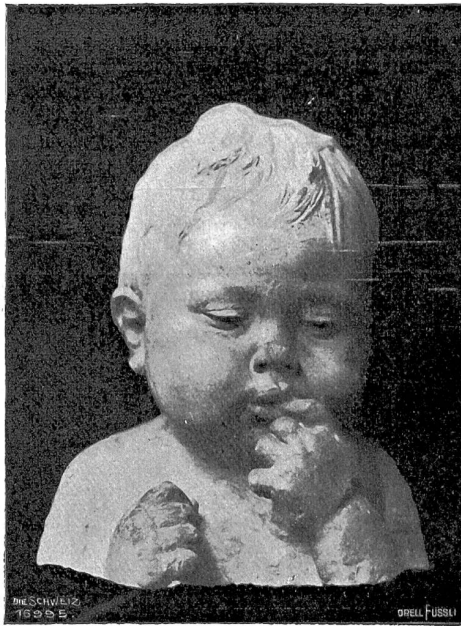
C. A. Angst, Genf-Paris. Kinderbildnis. Bronze.

Eine eigentliche Spezialität hat sich Angst, was gerade bei einem Dampf-Schüler nahe lag, aus der künstlerischen Wiedergabe des Kindes gemacht. Eine Anzahl von Zeichnungen (S. 548 f. 551 u. die Kunstbeilage) belegen, mit welcher Feinheit Angst in dieser Domäne sich bewegt: diese pausbäckigen Kinderköpfe aus einem Alter,