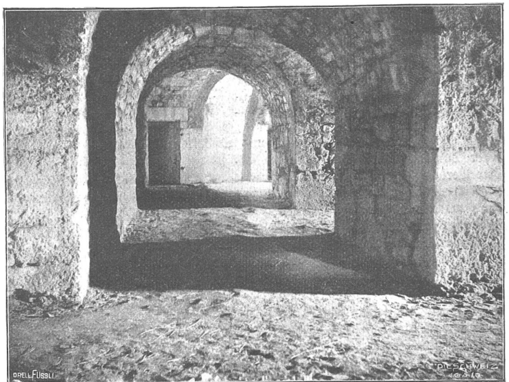
Festung Aarburg. Kasematten.