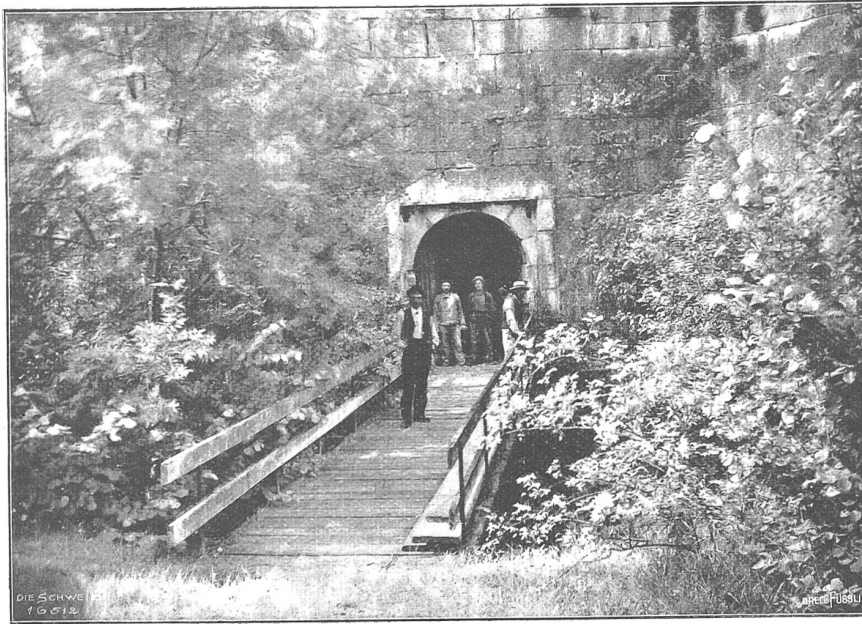
Festung Harburg. Wallgraben.

Straßen — es sind ihrer nicht viele — geht, zuerst durch anhaltendes Läuten die Aufmerksamkeit der Bewohner erregt und dann mit weitinhaltender Stimme das verkündet, was alle wissen müssen. Manchmal sind es auch nur „frische Blut- und Leberwürste“, die er „ausläutet“; aber man ist doch froh, auch das zu wissen. Zu den alten Bräuchen darf man wohl auch das Schießen bei Brandfällen rechnen. Zwei schwere Kanonen, die allen Zeitläuften getrotzt haben, stehen noch auf den Festungswällen, die eine nach Osten, die andere nach Westen, und je nach der Richtung, wo sich am Himmel die Brandröte zeigt, wird die eine oder andere abgefeuert. Es macht einen schauerlichen Eindruck, wenn mitten in der Nacht der dumpfe Kanonendonner unglücklich verkündend durch die Lüfte schallt.