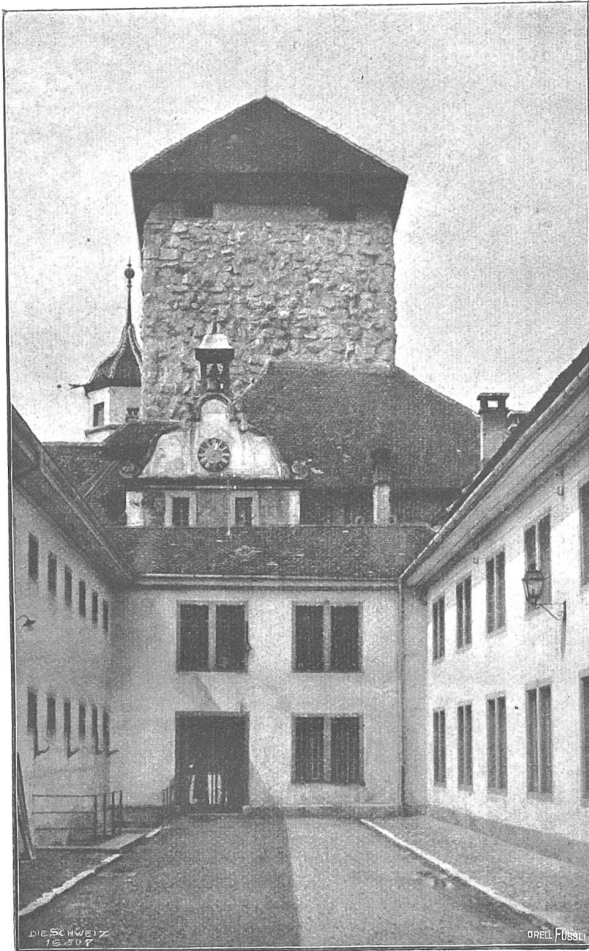
Festung Aarburg. Garzerturm.