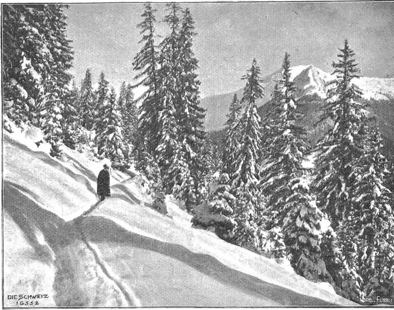
Winter im Gebirge (Phot. Willy Schneider, Davos).

scher Wind jagte die dicken hängenden Wolken am Himmel nutzlos umher —