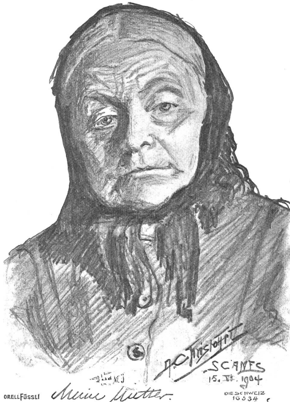
Bündner Typen. Die Mutter des Künstlers. Nach Bleistiftzeichnung von Anton Christoffel, Scans (Oberengadin).

Auf dem Ausläufer eines Hügels, der sich zum See vorstob, lag ein mit hoher Mauer gegürtetes Frauenkloster. Die Schwestern, die dort hausten, waren für die Welt abgestorben; nur ihr Glöcklein kündete Tag und Nacht von der ewigen Anbetung. Unter einem Vorbache war ein Schalter mit einem Tische zu schauen, in dessen Mulde man einige Bagen legte, um dafür die Platte mit dem Gelde verschwinden und eine gleiche erscheinen zu sehen, in deren Mulde so erworbene Küchlein lagen. Die Nonne, die das Werk regelte, blieb un-