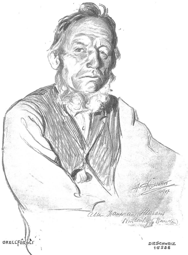
Bündner Typen. Bauer aus Scharans.

Nach Bleistiftzeichnung von Anton Christoffel, Scans (Oberengadin).