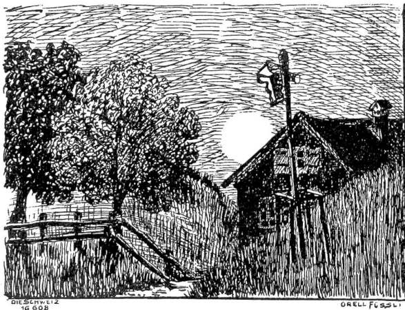
Motiv bei Appenzell. Nach Federzeichnung von Olga Amberger, Zürich.

„So sind sie alle, alle . . . Schuft du!“ schrie Lora, stürzte auf den Direktor zu und schlug ihn ins Gesicht.