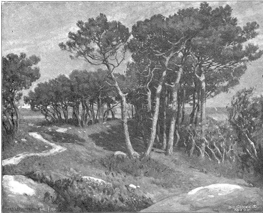
Hans Lendorff, Basel. „Les Pins de St. Gildas“ (Bretagne).

Landschaften, die uns, obgleich nicht besonders groß aufgefaßt, mit der angenehmen Tiefe ihrer Formen- und Farbenzusammenhänge noch jetzt deutlich vor Augen stehen. Auch Kinderporträts und Gruppen hat Lendorff damals ausgeführt, meist in Erledigung von Aufträgen Wohlgefinnter.