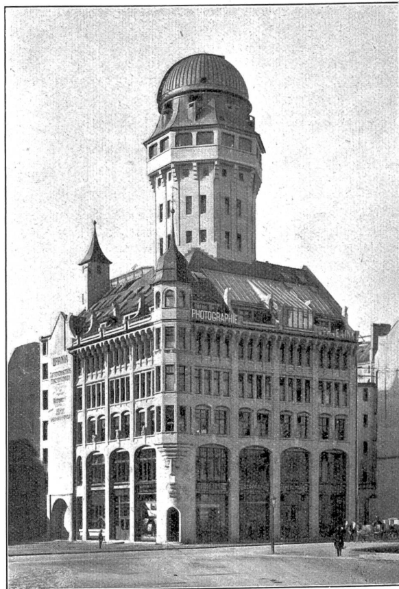
Die Volkssternwarte „Urania“ in Zürich.