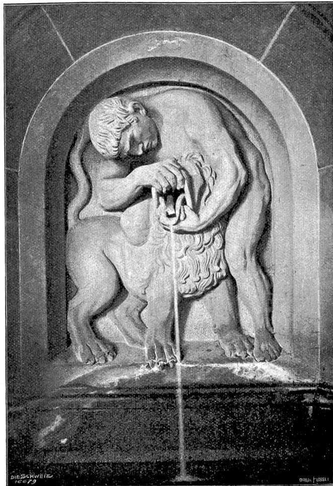
Eduard Zimmermann, Stans-München. Brunnen (1904) im Hof des Rathhauses zu Basel.