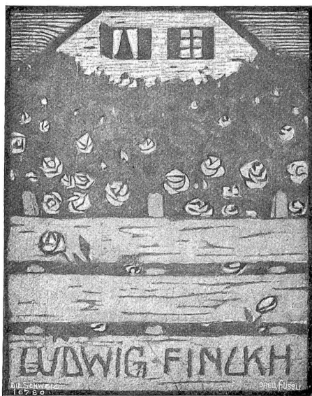
Max Bucherer, Basel. Exlibris Ludwig Finckh. Farbiger Holzschnitt.

haben einen gärenden Geschmack. Die Sonne sticht wütend, und schwarze Wolken erheben sich von Norden her. Sie geht der langen Reihe von Neben nach, die den Gartenweg begrenzen, und schaut hinaus in die schattenlose Landschaft. Ein ganz unerwarteter Anblick wird ihr zuteil. Die vorhin noch so menschenleere grüne Weite ist verwandelt, unheimlich belebt, wie die drohenden Wolken den glühenden Himmel beleben. Auf dem Pfade, der vom Städtchen hinausführt, zum Gerichtshaus und dem Bezirksgefängnis, geht in einer gewissen Ordnung eine lange Reihe von Männern, schweigend, fast in soldatischem Marsche. Doch was für Gestalten und in welcher nachlässiger Kleidung! Zum größten Teil sind es hagere, struppige, etwas gebückte Südländer Bauern aus den versteckten Flußtäälern herauf, wie sie Höhenwald früher fast ausschließlich gesehen, die aber seitdem beinahe gänzlich aus dem wachsenden Städtchen verschwunden sind. Ohne Hast und Hitze, leblos schier ziehet die Schar; doch in ihren