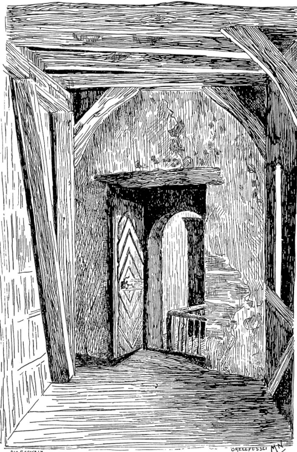
„Hürdengang“ (gedeckter Wehrgang) im Schloß Gröningen. Nach Federzeichnung von Marguerite Naegeli, Zürich.