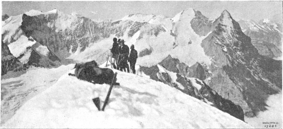
Auf dem Gipfel des Wetterhorns. Bild auf Eiger, Mönch und Biecherhörner.

einer Sinfonie nicht inhaltsschwer genug, ein Finale, das hingegen würdig und eindrucksvoll gestaltet ist. Es enthält eine überaus stimmungsvolle Einleitung, ein sich kraftvoll und feierlich gebendes erstes Thema und hierzu einen zart-melodischen Gegenjaz. Während sich Niedermann ein wenig an Bruckners Art hält, nimmt sich Philipp Nabholz mit seinem Männerchor mit Orchester des Hegar'schen Sages an. Er bringt in dem „Der Brunnen“ beitelten Werke eine gut gewählte Orchesterillustration des tragischen Textinhaltes.