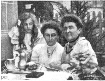
Lisa Wenger mit ihren Töchtern.

Mit zwei Bildnissen und drei Zierleisten (nach Zeichnungen von Lisa Wenger).