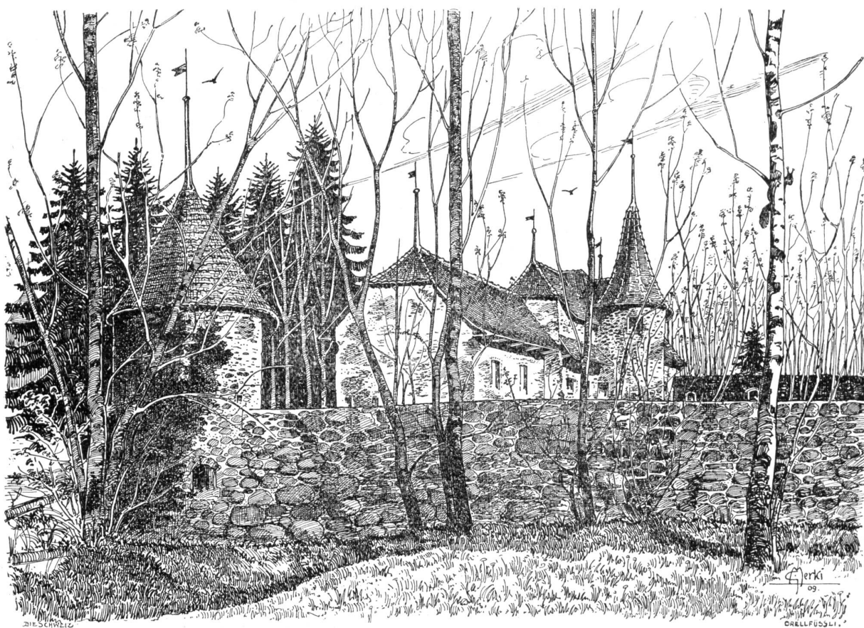
Schloß Hallwyl (von Westen). Nach Federzeichnung von Gottlieb Merki, Männedorf.

Sie schritten Seite an Seite nach der Lücke im Buschwerk, von der aus sie den Nachthimmel und den Mond sahen. Ihre Herzen pochten. Jedes wußte es vom andern.