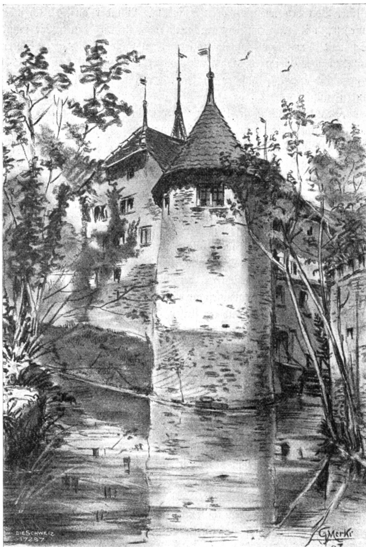
Schloß Hallwyl (von Osten). Nach Kohlenzeichnung von Gottlieb Merki, Männedorf.

Es war eine wundersame Wanderung. Anfänglich schauten sie sich manchmal um. Es tönten Stimmen in ihren Rücken, und sie nahmen an, daß andere Gäste ihnen folgten. Allein die Stimmen verhallten. Nun war nur noch das Knirschen des Kieses, das Geräusch der schwe-