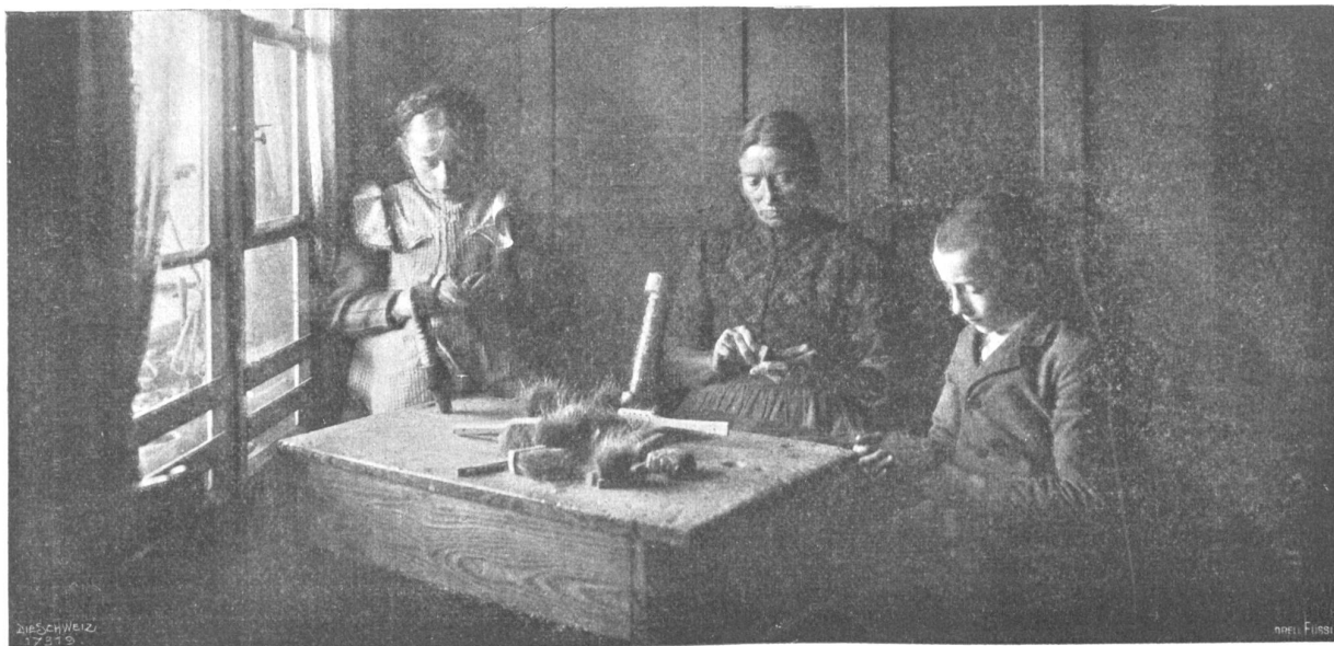
Von der I. Schweiz. Heimarbeitausstellung. Mutter und Kinder beim Bürstenmachen.