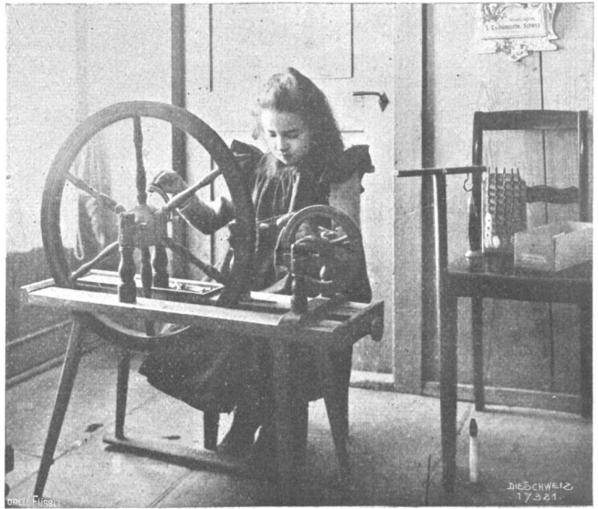
Von der I. schweiz. Heimarbeitsausstellung. Achtjähriges Mädchen am Spulrad.

Noch einige Einzelbilder aus der Ausstellung. Das bisher Mitgeteilte, das gleichsam hinter den Kulissen der Ausstellung liegt, erklärt eben die Ausstellung selbst, ihre Berechtigung und Notwendigkeit. Sechzig Photographien in der „Literarischen Abteilung“, denen auch unsere Abbildungen entnommen und wovon dreißig als Ansichtskarten in der Ausstellung zu haben sind, zeigen uns z. B. liebliche Familienidylle, ganze Familien bei der Heimarbeit versammelt, in der wohllichen, oft auch unwohllichen Stube oder Kammer. Man hat da oft den Eindruck, daß Streik, Klassenkampf, Parteitreiben, Genußsucht und was sonst die Familie zerreißt und den Familienstern zerstört, hier keine Stätte haben, nicht einmal bekannt sind. Und welche Bedürfnislosigkeit und Bescheidenheit! Rührend hört es sich an, zahlreiche