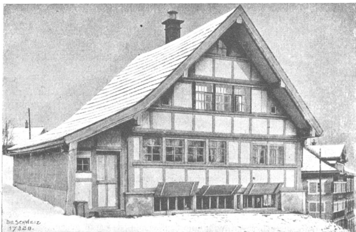
Von der I. Schweiz. Heimarbeitausstellung. Appenzellerhaus mit Webkeller.

O, sie hatte ihn noch immer gern, jetzt vielleicht mehr als damals vor zwei Jahren! Erst nachträglich, immer deutlicher in der letzten Zeit, war es ihr zum Bewußtsein gekommen, daß die dunkeln Augen des verliebten Jungen es eigentlich gewesen seien, die ihr den Mut und das Glück brachten, deren sie für ihre Künstlerlaufbahn so notwendig bedurfte. Daß sie früher nie daran gedacht hatte? Aber damals hatte ihre Kunst nur dem einen ehrgeizigen Streben dienen müssen, die Achtung und die Liebe eines Pianisten zu erlangen, der erst ihr Lehrer, dann ihr Gatte wurde.