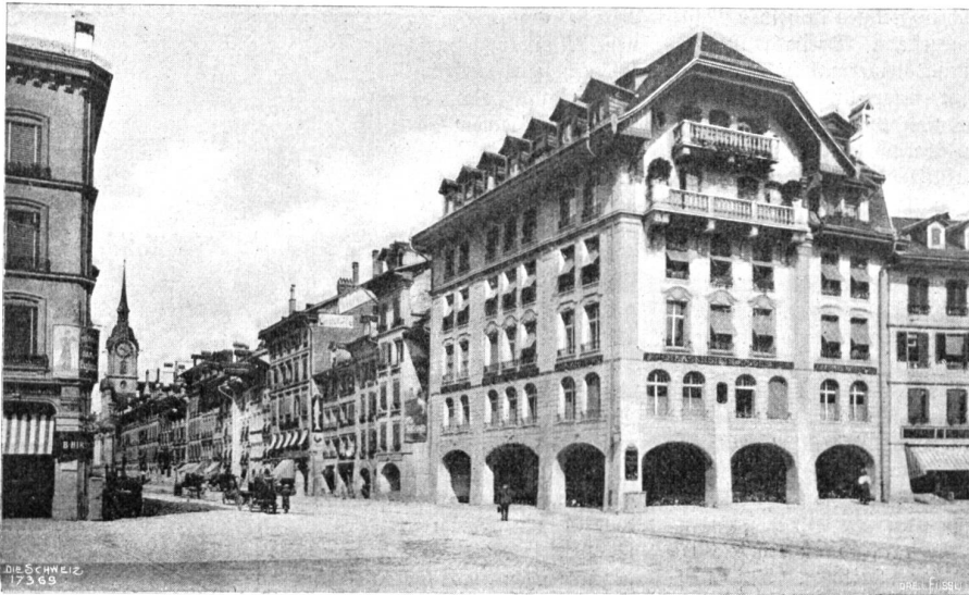
Neue Berner Baukunst. Warenhaus Zurbrügg an der Spitalgasse. Architekt: Eduard Joos, Bern.

die]Madonna von Caravaggio. — Die Bilder des heiligen Lucio sind besonders interessant, weil sie uns zeigen, wie sich die Aeppler und Sennen in den vergangenen Jahrhunderten gekleidet haben; auch der Käse, das Käsemesser, das Salz- oder Lecktäschchen ist auf Gemälden und Statuen getreu wiedergegeben. Für den Trachtenforscher noch ein schönes, unbebautes Feld!