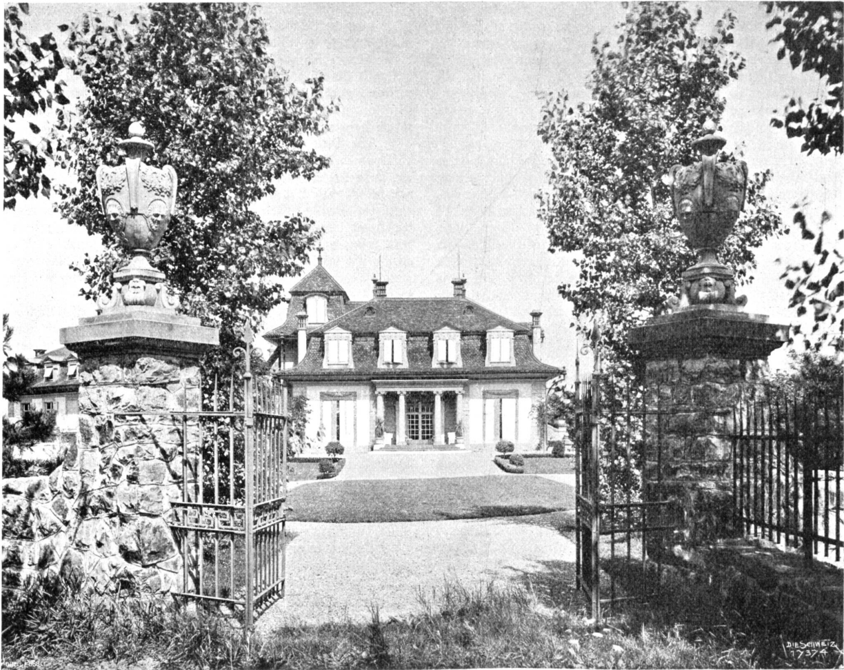
Neue Berner Baukunst. Villa „Le Pavillon“ am Thunplag. Architekt: G. W. von Fischer, Bern.

mit ihr stehe. Daß es mir gelingen wird, sie zu gewinnen, daran zweifle ich nicht; ich habe schon ganz andern Weibern imponiert. Es ist etwas Feministisches in mir; darum verstehe ich die Frauen so gut. Niezsche hat recht, man muß sie behandeln wie edle Pferde. Merken Sie auf: Harter Arm und weiche Hand!"