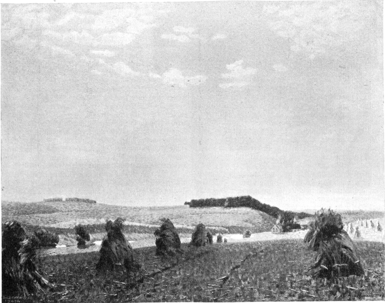
X. internat. Kunstausstellung München.

*) Zwei der Kunstbeilagen werden in spätern Heften nachgetragen.