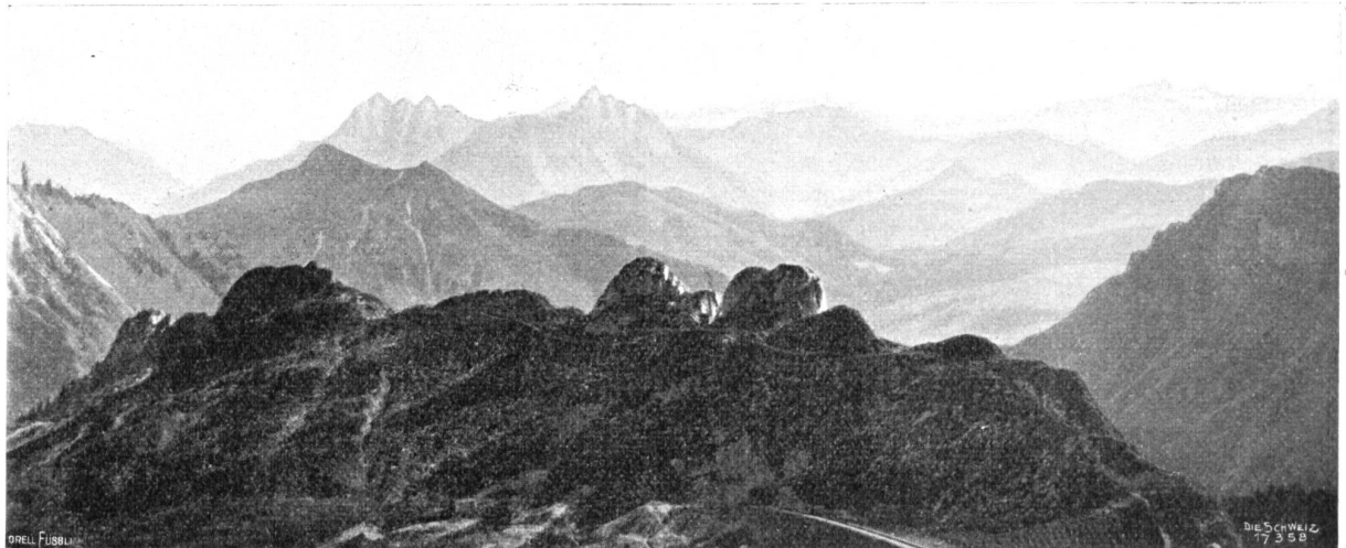
Rochers de Naye (mit Alpengarten „ Nambertia “).