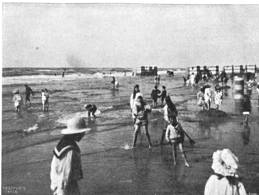
Basel-Rotterdam Abb. 8. Scheveningen (Meerbad).

Bei starkem Gegenwind und jagendem grauem Gewölk über uns fuhrn wir andern Tags von Drsoy weg. In Wesel passierten wir die letzte Schiffbrücke! In dem kleinen Dorf Bynen suchten wir vergebens etwas Gbbares aufzutreiben. Dagegen war der Blick von dem hohen Deich hinaus in die weite, fruchtbare Ebene mit den weiß-schwarz gefleckten Klüben, den Windmühlen und Baumgruppen überaus reizvoll. Vor Nees nahmen die durch den heftigen Nordwind aufgeweiteten Wellen immer unangenehmere Größe an. Der Schaum, der über den Wellenbrecher spritzte, lief uns fortwährend den Rücken hinunter,