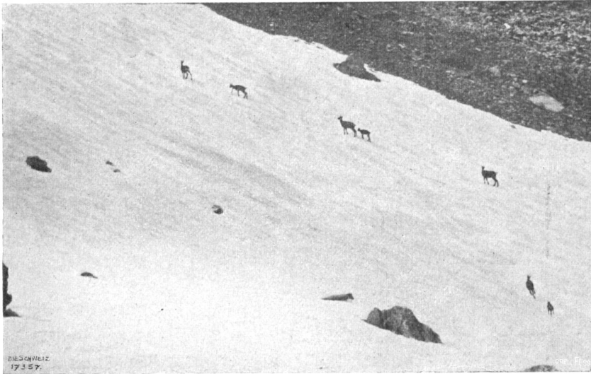
Photographische Seltenheit aus unsern Freibergen. „Verhoffende“ (stillstehende oder beobachtende) Gemsen.

Kantonen Wallis und Graubünden je drei Bannbezirke (Freiberge) von angemessener Ausdehnung für das Hochwild auszuscheiden und unter die Oberaufsicht des Bundes zu stellen.“