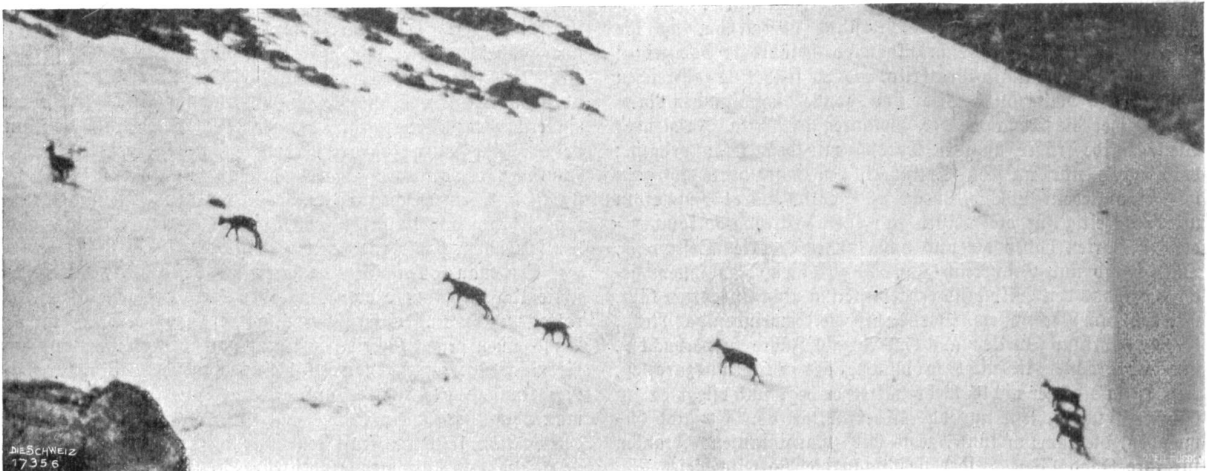
Photographische Seltenheit aus unsern Freibergen. „Ziehende“ (langsam weitergehende) Gemsen.