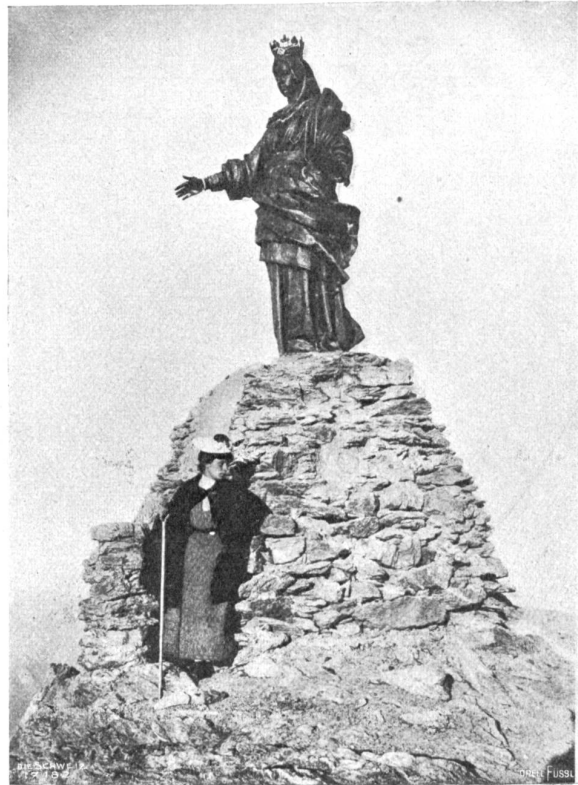
Madonna di Roccamelone. Ebernes Madonnenbild auf dem Gipfel des Roccamelone.

Schärfe macht sich auch in diesen „niederländischen Dichtungen“ geltend, die eine Reihe historischer und sagenhafter Motive mit großem Geschick und in wirkungsvollster Weise poetisch ausgestaltet zeigen. Nur ein paar der gelungensten Stücke seien hier namhaft gemacht. So verdienen in erster Linie die beiden Gedichte „Heemskerck's Heimfahrt“ mit seinem eleganten, leichtflüssigen Strophenbau und dem prächtigen Finale: