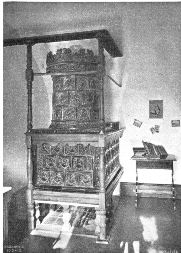
Schloß Marchlins. Prättigauer (Luzerner-) Ofen in einer Dachstube.

wohl damals der Fall gewesen ist. Denn mag man auch, speziell was die technische und künstlerische Ausgestaltung ihrer Dichtungen anbetrifft, der Bündner Sängerin nicht überall und bedingungslos folgen oder ihr gar den Preis einer völlig abgeklärten und formal ausgereiften Poetennatur zuerkennen wollen, eine eigenartige, kraftvolle, selbstbewußte und durch ein reiches inneres Erleben und Erleiden ausgezeichnete Persönlichkeit ist es doch, deren dichterische Bekenntnisblätter uns in diesem Buche vorliegen! Man hat freilich oft mehr die Empfindung, es mit einer stolz und tapfer kämpfenden, sich nach Freiheit im Leben und Befreiung im Kunstwerke sehnen den Frauenseele zu tun zu haben als mit einer von Apollons Gaben besonders begnadeten Mulendienerin, und dieser Eindruck, den so manche ihrer Lieder bei uns hinterlassen haben, ist gewiß kein ganz ungerechtfertigter zu nennen. Im Vordergrund der lyrischen Schöpfungen von Meta von Salis steht zunächst der Mensch, und erst dann kommt auch die Dichterin, soweit sie sich um die üblichen, bisher geltenden poetischen Gejeze,