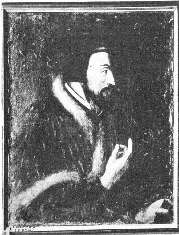
Johann Calvin (1509—1564), Reformator, Gründer der Genfer Universität.