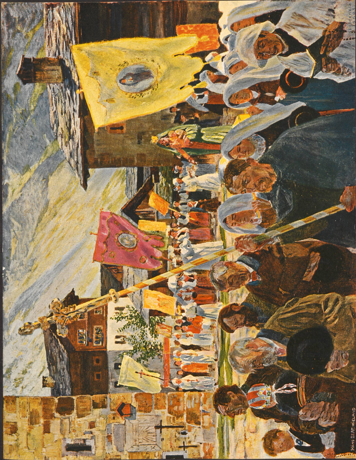
Prozession zu Epolend. Nach dem Gemälde von Hans Beat Wieland, Hofel-Mündchen.