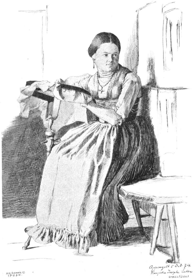
Innerhändlerin am Stickrahmen. Nach Federzeichnung von Victor Tobler, Trogen-München.

söhne seien ja gar nicht hier daheim, sie benähmen sich so, als ob sie ums Teufels Gewalt alles in Grund und Boden treten wollten, was die Heimat an guter Sitte und edeln Bräuchen hervorgebracht, als wollten sie überhaupt keine Gemeinschaft mit den Bürgern von Nifon, sowenig wie die Polen mit den Preußen. Wer die ungeschriebenen Gesetze schnöb verlege, die eben gerade darum heilig seien, weil sie aus dem Gefühl ihr Leben bezögen und nicht bloß in dürren Buchstaben niedergelegt seien, der müsse sich nicht wundern, wenn man ihm alles Gemeine und Niederträchtige zutraue und wenn alles gegen ihn Partei ergreife, aufstehe und ihn zum Lande hinausjage. Wie sie die Leute ausbeuten, sei unerhört. Und ob es ihnen denn darum besser ginge, fragte er sie. Sie sahen ja beide aus, als ob sie den ewigen Hunger hätten.