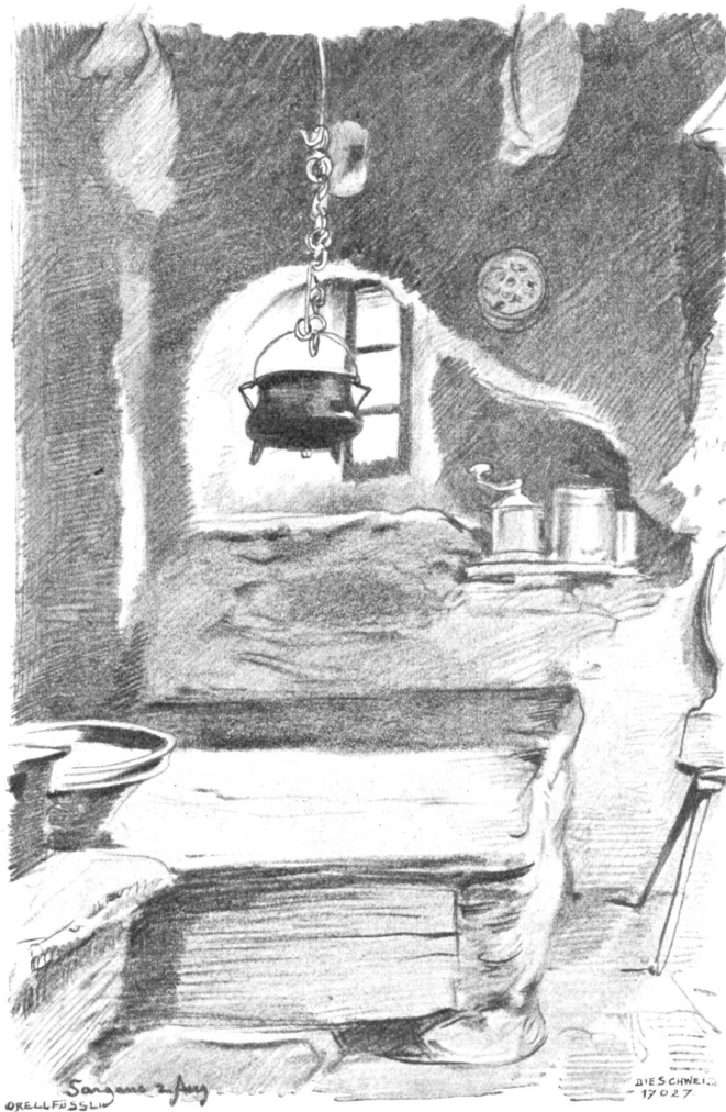
Rüchinterieur aus Sargans. Nach Bleistiftzeichnung von Victor Tobler, Trogen-München.

Die Brüder merkten, daß sie Verdacht schöpfte, und wollten ihr Vorhaben nicht durch weitere Zudringlichkeit gefährden.