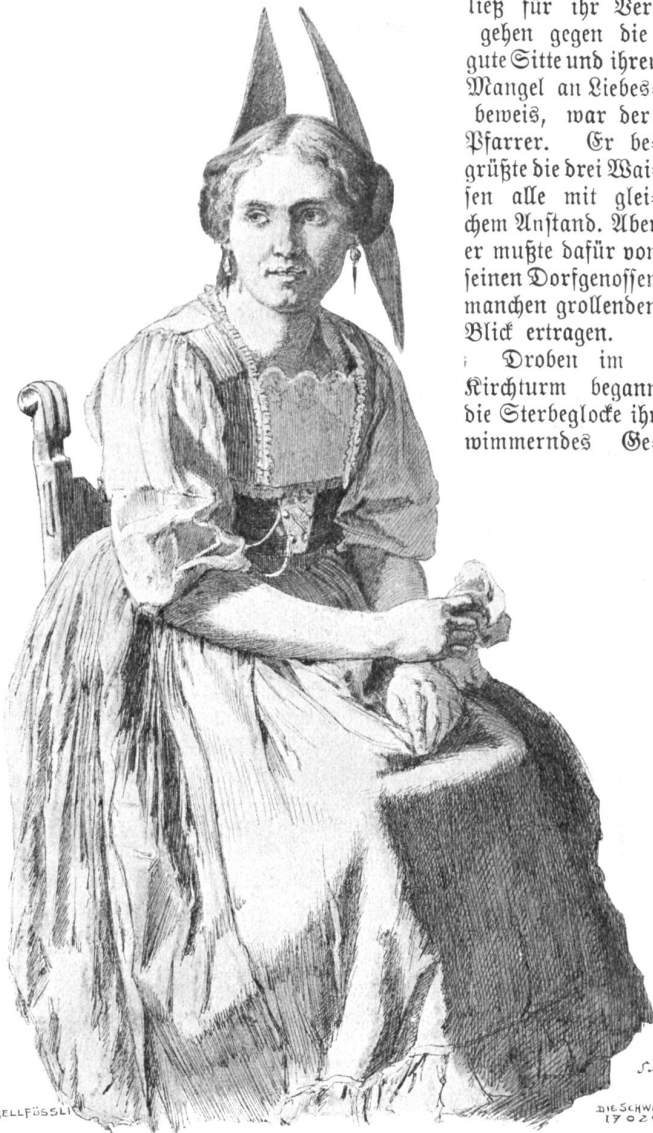
Innerhändlerin. Nach Federzeichnung von Victor Tobler, Trogen-Münchener.

Schade bloß, daß sie das kostbare Getränk mit den Trauergästen teilen mußten! Aufmerksamere Gastgeber waren sie nun gerade nicht; auch die Unterhaltung wollte nicht ins Fahrwasser der Gemütlichkeit kommen, und deshalb brachen die Gäste bald, nachdem sie gespeist und den Mund gewischt hatten, auf. „So,“ seufzte Thies erleichtert auf, „jetzt wären wir und nicht mehr das Weibervolk