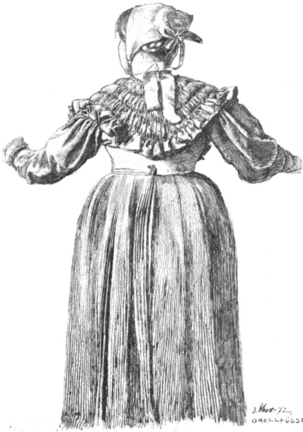
Trachtenstudie in Federzeichnung von Victor Tobler, Trogen.

reden wollte. Die Herren wußten ja, weshalb man sie hergerufen habe. Wie es denn stände mit dem Gelddarlehen, das nötig sei, um Lene abzufinden. Da ver setzte der Notar: „Keinen roten Heller kriegt ihr im Dorf! Die Besten und Wägsten habt ihr euch entfremdet. Wie aber die Bauern einem das Leben sauer machen und zuleidwerken können, wenn man's mit ihnen verdorben hat, das wißt ihr. Wie oft haben euch die Nachtbuben das Wasser von der Mühle abgeleitet,