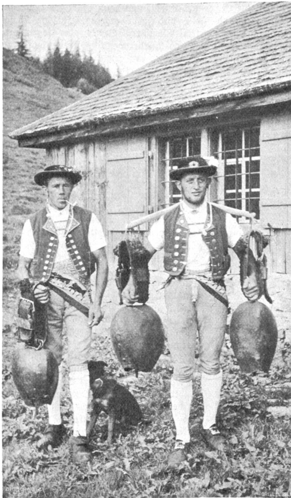
Toggenburger Sennen mit „Treichen“, zur Alp-fahrt bereit.

Da mußte er es von Minute zu Minute bitterer spüren, wie ihm der Lorbeer welkte. Das war andere Kunst als sein Gezirkel und Gespränge! Da gab es große klare Linien, ruhig entfaltet, und deutliche Figuren, mit spielender Sicherheit symmetrisch gepaart und auf der Spur wiederholt. Und im Wechsel von kurzer anmutiger Kreislung und lang hinschweifender Wucht ein nie versagender Adel der Bewegung, von der glücklichsten Gestalt in knappenliegendem Sportkostüm prächtig unterfüßt! Unter der Pelzmütze das feine Gesicht trug um den Mund einen stolzen abweisenden Zug und in den Augen eine wahrhaft fürstliche Gleichgiltigkeit, wenn nicht gar Geringschätzung gegen die Zuschauer.