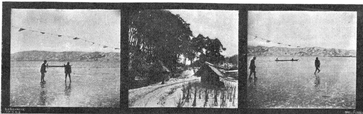
Auf dem Suwasee.