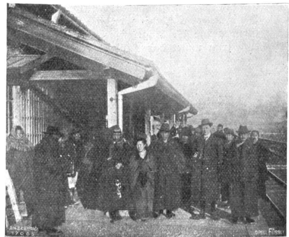
Abfahrt von Suwa.

So saßen wir lange und schauten auf das schimmernde Herz. Allmählich zog der Sonnenstrahl weiter, der Glanz wurde matter, immer matter, und endlich erlosch er.