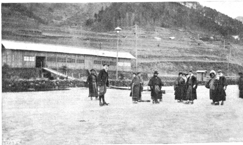
Auf dem Suwasee.

Unbekümmert um unsere und des Präsidenten Wünsche begann allzufrüh die Sonne ihre Arbeit und triumphierte über das Werk der Nacht. Bis auf wenige Meter schwammen Boote im offenen leichtgekräuselten Wasser an uns heran, und ein rasch sich verbreiternder Wassergürtel drohte uns vom Lande abzuschneiden und unsern ganzen Sportplatz in ein schwimmendes Floß umzuwandeln. Wir gaben nach. Der Weiher weit hinten im Gebirge, den ich vom Vorjahr her kannte, mußte länger im Schatten sein. In einem Gilmarsh von einer Stunde erreichten wir ihn. Das Eis war fest genug, aber zu rauh. So streiften wir im sonndurchstrahlten Winterwald herum, an einsamen Mühlen vorbei, deren Räder von Eiszapfen starren und funkelten. Hier, im Schatten des Berges, war auch der Schnee in dünner Schicht liegen geblieben. Gegen Abend setzte wieder eine ganz erfreuliche Kälte ein und festigte den Platz auf dem See genügend. Das Eisfeld hatte seit letztem Jahr auch elektrische Beleuchtung erhalten. Es wurde bald recht belebt, und wir sahen die außerordentlichen Fortschritte im Laufen, die hier nicht wenige