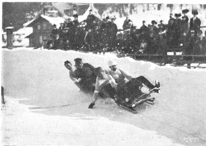
Bobsleigh am Ziel.