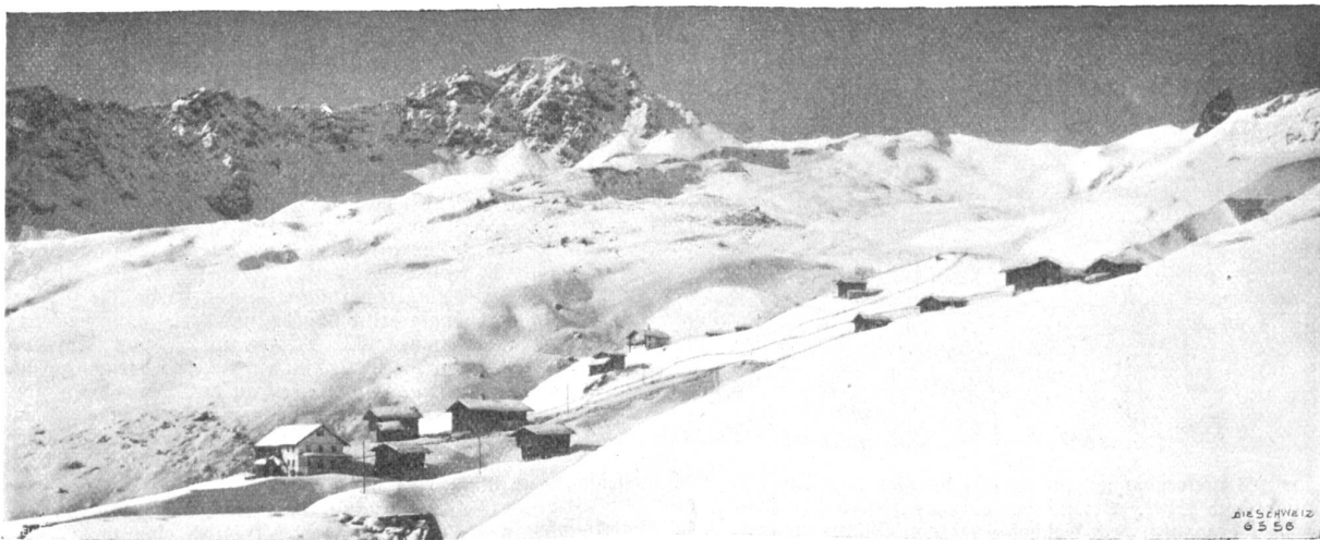
Inner-Ärofa im Winter (Phot. Gottfried Kuratle, Zürich).