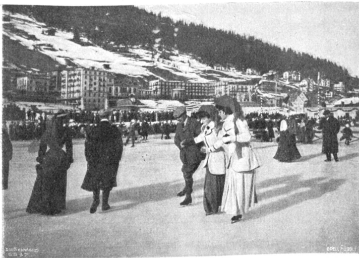
Davoser Eisbahn: Ein elegantes Trio.