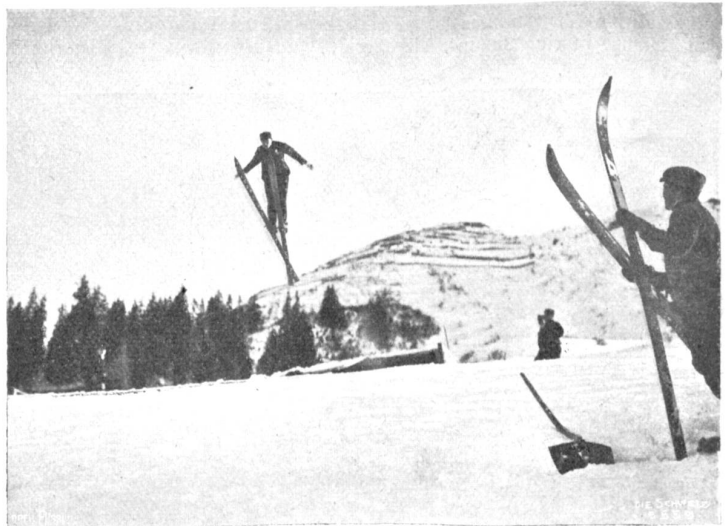
Der Norweger Björnstad im Sprung (Phot. Anton Krenn).