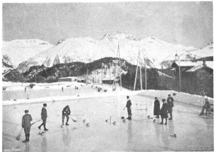
Curlingbahn in St. Moritz.