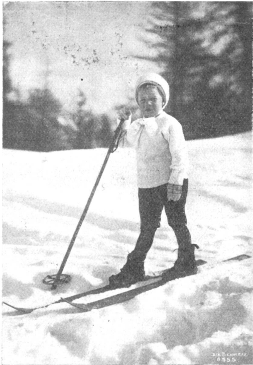
Kleiner Skifahrer aus St. Moritz.

bardement, wozu sich besonders die Frucht des Apfels zu eignen scheint, ganz besonders, wenn es sich um überaus stark ausgereifte Exemplare handelt. Zischen und Pfeifen wird daher auch nicht selten durch Anschlag in den heiligen Mäusen dramatischer Kunst verboten, und ein derartiges Verbot erschien zum ersten Mal 1690 in Frankreich gelegentlich einer Aufführung der Oper „Orpheus“ von dem jüngern Lully. Denn juist um diese Zeit war das Zischen in Mode gekommen, und es reifte bald zu einem großen Vergnügen des Publikums aus. Das erste Stück, das man auspiffte und auszischte, war eine Tragödie „Alpar“ von Fontanelle, dessen Name lediglich durch dieses Intermezzo der Nachwelt erhalten geblieben ist. Vorher war es Sitte gewesen, im Zustande des Mißfallens mit Äpfeln nach den unglücklichen Komödianten zu zielen, und als einmal in der Normandie ein Stück von einer wandernden Schauspielertruppe aufgeführt werden sollte, stellte eine Zeitung am Tage der Aufführung boshaft die Frage, ob es auch genug Äpfel für diesen Abend in der Normandie geben werde.