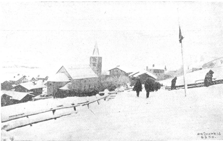
Tag. Ansicht der Kirche und des Dörfchens.

Besitzes notwendig sei zur Erhaltung von Familie, Ordnung, Zucht und Sitte. Bereits sind einzelne konservative Heißsporne soweit gegangen, dem Reichszanler von Bülow in aller Form Freundschaft und Vertrauen zu künden, weil er die Partei gebeten hatte, die Finanzreform samt der Nachlasssteuer zu akzeptieren. Fürst Bülow selbst steht und fällt mit der Finanzreform, das ist der Eindruck, den die gegenwärtigen Auseinandersetzungen hervorrufen.