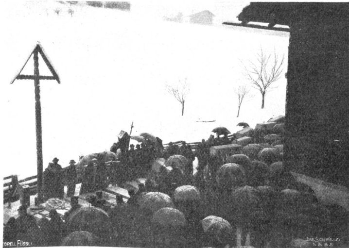
Die Beisetzung der Opfer der Katastrophe in Nar.

Freundeidgenössische Hilfe hat sich sofort nach Bekanntwerden der Katastrophe im ganzen Lande eingestellt, und so steht zu hoffen, daß wenigstens in materieller Beziehung die Einwohner von Nar nicht allzuschwer getroffen werden. Von den dreißig Verletzten sind seither noch sechs gestorben, und es steigt die Zahl der Opfer damit auf vierunddreißig. B.