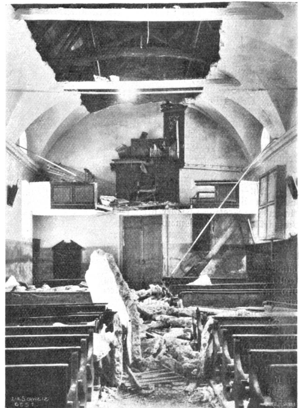
Innere der Kirche zu Naz nach dem Einsturz.

Ein großes Stück des Gewölbes — etwa dreizehn Meter in der Länge und sechs Meter in der Breite — aus Tuffstein und Kalkgips bestehend, war eingestürzt. Berichten nach bestand im Gewölbe der Kirche schon längere Zeit ein größerer Riß, der im Frühjahr ausgebeffert werden sollte. Den meisten der Verunglückten blieb ein längerer Todeskampf glücklicherweise