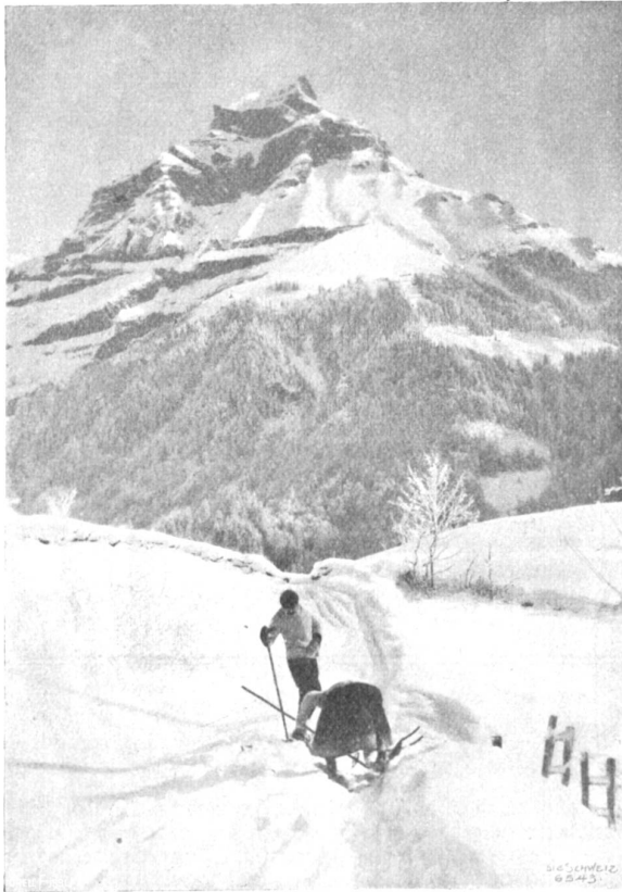
Der Hahnen bei Engelberg.

mus an keiner ihrer Toiletten fehlen ließ, so können sich heute die Bobfabrikanten der ganzen Welt beim deutschen Kronprinzen bedanken, der mit seinem Bob „Kismeth“ alle Winter die St. Moritzer Bahn hinunterrauft, zum hellen Entzücken seiner zukünftigen Untertanen und der wackeren Bündner, die heute mit ihrer Wintersportzentrale wohl überhaupt die erste Geige im internationalen Sportkonzert spielen. Die Forscher mögen mit ihren Chroniken der Weltgeschichte den kommenden Geschlechtern unschätzbare Dienste leisten; aktueller aber für Hunderttausende ist ein Bericht des Sportsreferenten, welcher Engländer in Davos auf der Schatzalpbahn gesiegt, wer in Les Avants auf dem Curlingplatz den Preis geholt, welches Pferd in St. Moritz im Skiföring als erstes durchs Ziel gegangen, welcher Norweger auf dem Holmenfolm oder am Gurschen in Andermatt den weitesten Skifprung getan. Das Chronometrieren von Fünftelsekunden ist ein eigener Beruf geworden, und die Namen berühmter Rennschlitten sind heute geläufiger als die der Regenten europäischer Staaten.