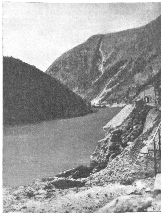
Ex oriente lux. Abb. 2. Im Flußtal des Starajut (Linie Debaghatich-Saloniki).

und Schweinen, nicht nur die dort nicht seltene Fata Morgana, sondern auch unser Gedächtnis zaubert manch lebens-