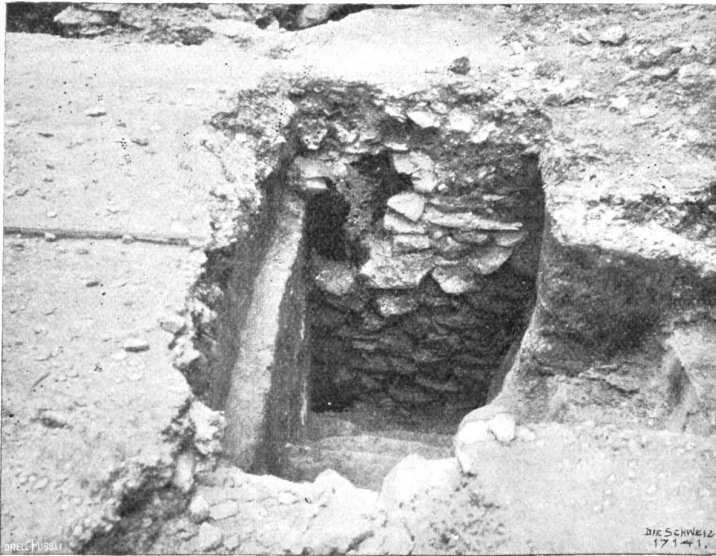
Husgrabungen in Difentis. Nördlicher Abstieg zur Krypta.