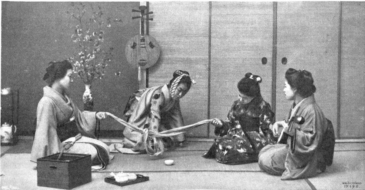
Japanische Kinder Spiele Abb. 1. Das Konfonchi-Spiel.