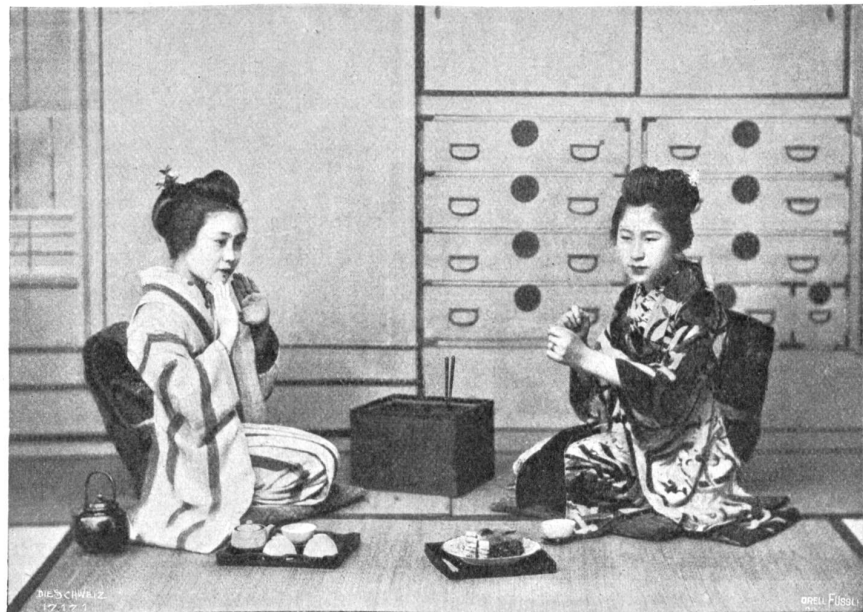
Japanische Kinder Spiele Abb. 5. Das Men= Spiel.