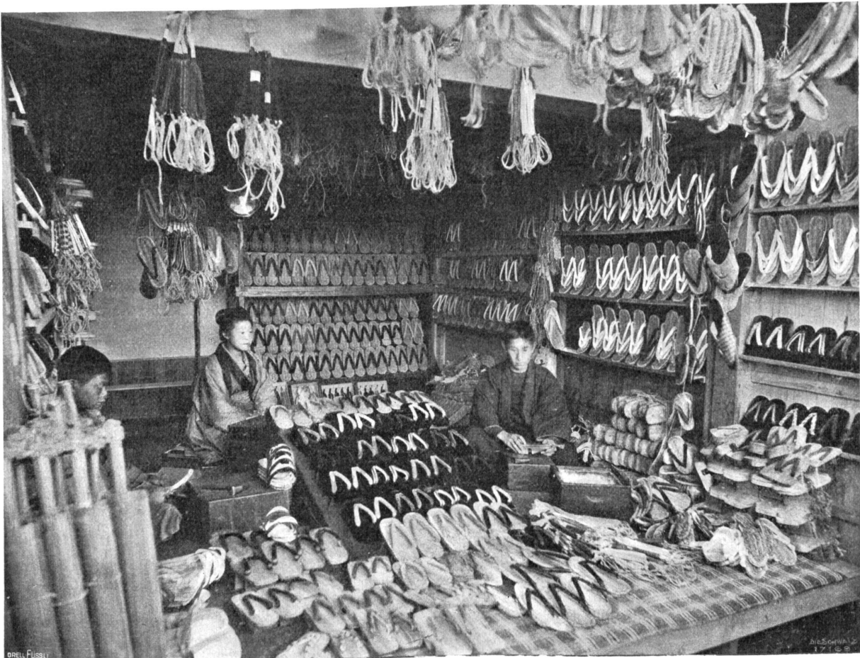
Japanische Kinderspiele Abb. 3. Japanischer Schuhladen.

Auch das ungemein beliebte Konkonchiki (vgl. Abb. 1) knüpft an die grenzenlose Schlaueit der Füchse an. So ergötlich kann dieses Spiel wirken, daß selbst ernsthafteste Europäer sich beim Zuschauen oft vor Heiterkeit krümmen, und es wäre wohl wert, auch bei unserer Kinderwelt Eingang zu finden. An sich ist es freilich sehr einfach; denn es