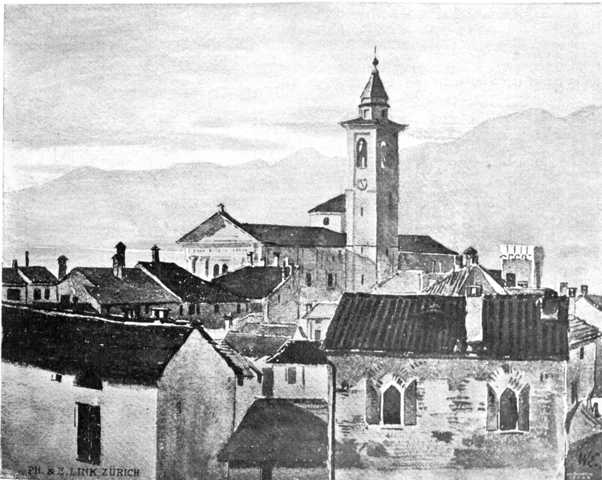
Walter Enholts, Basel. Locarno. Aquarell.

„Sie wird krank sein oder hat die Glocken nicht gehört,“ schloß sie, als sie umsonst Umschau gehalten hatte.