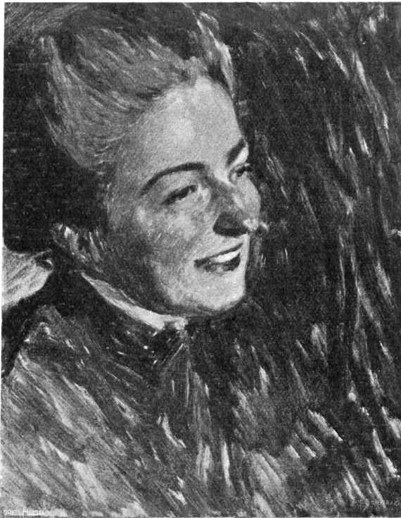
Fritz Burger, Basel-Berlin. Bildnis der Frau von S., Studie (1908).