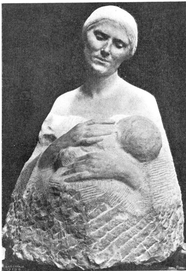
Louis Gallat, La Chaux-de-Fonds-Paris. Mutter erglückt (Maternité). Rosa Marmor. Eigentum der Schweiz. Eidgenossenschaft.

Ich nahm aus der Hand des Arztes ein kleines Heft, etwa in der Größe eines Quartbogens, das mit einer großen steilen und unregelmäßigen Schrift beschrieben war. Folgendes erfuhr ich aus dem Manuskript, das ich hier getreu wiedergebe, dank der liebenswürdigen Erlaubnis des Arztes.