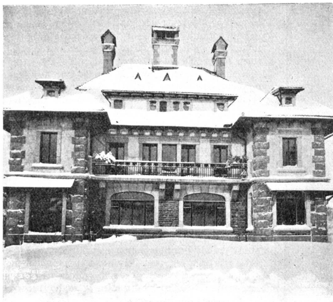
Louis Gallet, La Chaug-de-Fonds-Paris. Haus im Hoch-Jura. Fassade.

manier des Arztes versetzte mich geradezu in Wut, und ich schrie aus vollem Halse: „Dummkopf! Bedant! Sie sind viel mehr verrückt als ich!“ — Ich wiederhole, daß dieser Ausruf höchst unvorsichtig und unflüchtig war; allein ich drückte nicht einmal den hundertsten Teil der boshafsten Gehässigkeit aus, mit der die Fragen des Oberarztes durchtränkt waren.