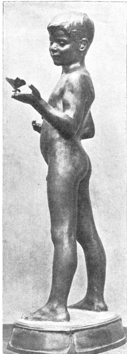
John Dunand, Genf-Paris. Knabe mit Schmetterling. Bronze-statue.

Die ganze düstere Wolkennacht suchten sie mit Windlichtern und Laternen weit in das schwarze Moor hinein. Erst in der fahlen Dämmerung eines trüben Morgens fanden sie Tetje. Er war stumm und kalt — in den Himmel gegangen —