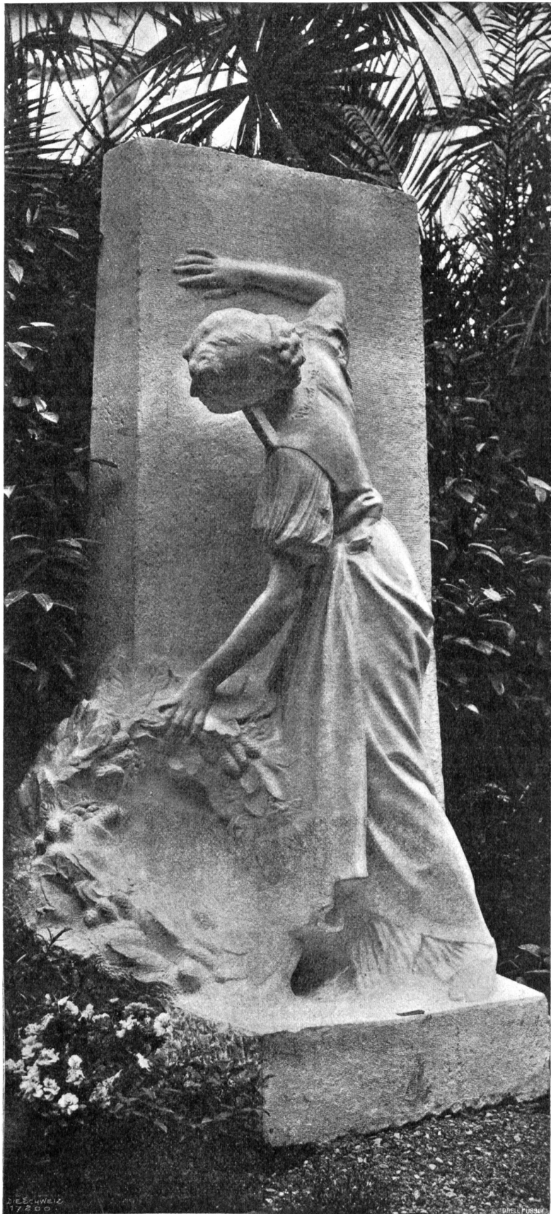
Louis Gallet, La Chaug-de-Fonds-Paris. Grabdenkmal für Herrn G. Marmor.

„Warte nur, Bruder, man wird dir Ketten anlegen; dann wirst du erfahren,