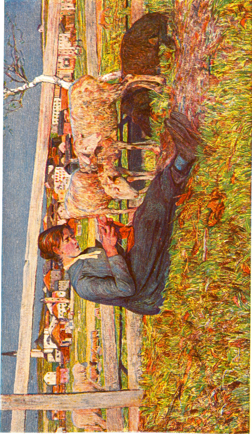
Giovanni Segantini (1858—1899).