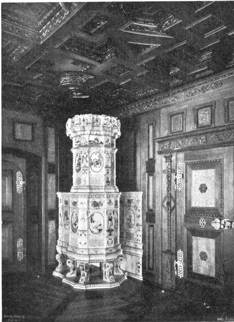
Schloß Marchlins. „Stangerzimmer“ mit Winterthurer Ofen.

Wie Leuthold nun von Natur aus zu einem überaus lebhaften und starken Innenleben geführt wurde und es ihm in der Folge an irgendwelcher äußern Beschäftigung, die das Gleichgewicht seiner ganzen menschlichen Existenz herbeigeführt und erhalten hätte, fehlte — da richteten sich seine ganzen Fähigkeiten und Energien im Laufe der Zeit nach innen, und so gewannen seine seelischen Erlebnisse nach und nach jene unheimliche Stärke und Heftigkeit, die früher oder später zum Ruin seines Geistes führen mußte. Und in der Tat klagt denn auch der Dichter schon früh über