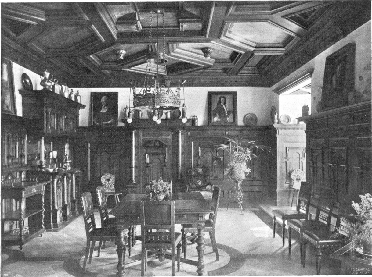
Schloß Marfchlins. Ehemaliges „Stüßzimmer“, jetzt Eßzimmer, ausgestattet mit zur Zeit des Umbaues schon vorhandenem Mobiliar.

Raum sind wir aber unter Lobsprüchen auf das Hotel und seine billigen Preise einige hundert Schritte vorwärtsgegangen, da steh' ich bei der nächsten Straßenbiegung vor meiner schwefelgelben Italienerin von gestern, und wie Hegen-spuk taucht sofort in meiner Seele wieder auf von Tristans und Isolde, Brangänen und Meloten, und ich verfinke wieder ins Reich des Unbewußten und gehe träumerisch und mechanisch neben meinem Reifegespan her den Berg hinan. Er löst in-zwischen juristische Probleme und redet — ich glaube mich noch ganz dunkel daran erinnern zu können — davon, wie man in jeder Gegend aus der Art des Feldbaus auf das dajelbst gel-