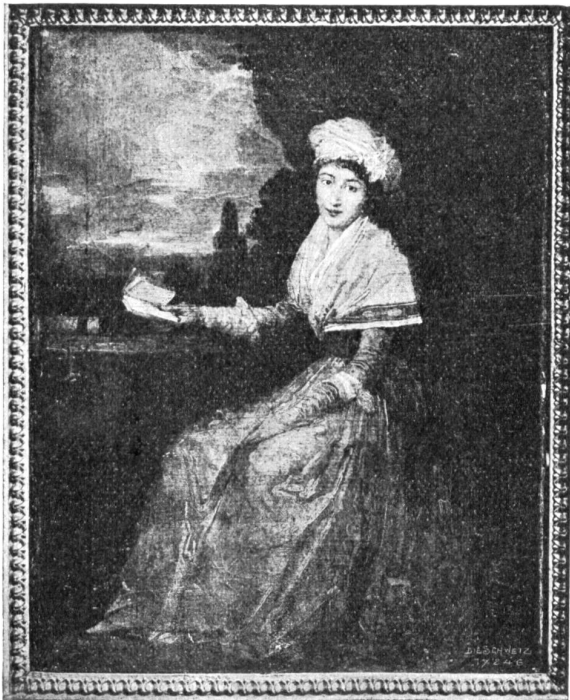
Angelika Kauffmann (1741-1807), Selbstbildnis in Basler Privatbesitz.