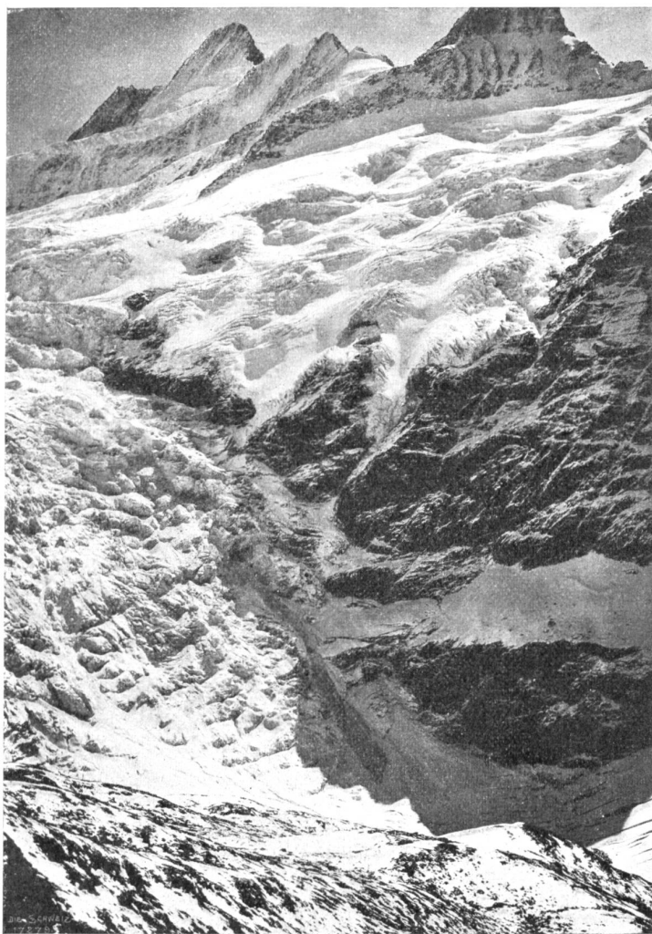
Großes Schreckhorn mit Grindelwaldfirn.

tholiken. Der Hauptaltar ist ein sehr wertvolles Werk des berühmten Bösch, von dem noch ein zweiter Altar hier steht, aber merkwürdigerweise im Abteil für die Reformierten. Frage: Könnten nicht diese auf das für sie wertlose Stück zugunsten der Katholiken verzichten zum Danke dafür, daß diese ihnen von sich aus die Mitbenützung der Kirche eingeräumt haben? An die Ueberlassung könnte ja immerhin die Bedingung geknüpft werden, daß der Altar Eigentum der Protestanten bleibe, so gut wie die ganze Kirche Eigentum der Katholiken ist, obschon ein Teil von den Reformierten benützt wird. Das gute gegenseitige Einvernehmen, das der Simultangebrauch der Kirche befundet, könnte durch ein solches Entgegenkommen, das für die Protestanten mit keinem Opfer verbunden wäre, nur gefördert werden. Diese Gedanken bewegten mich, als ich am Morgen das Gotteshaus aufsuchte und daselbst den gelehrten Pfarrer über einen schwierigen lateinischen Asketen gebeugt im Chöre antraf.