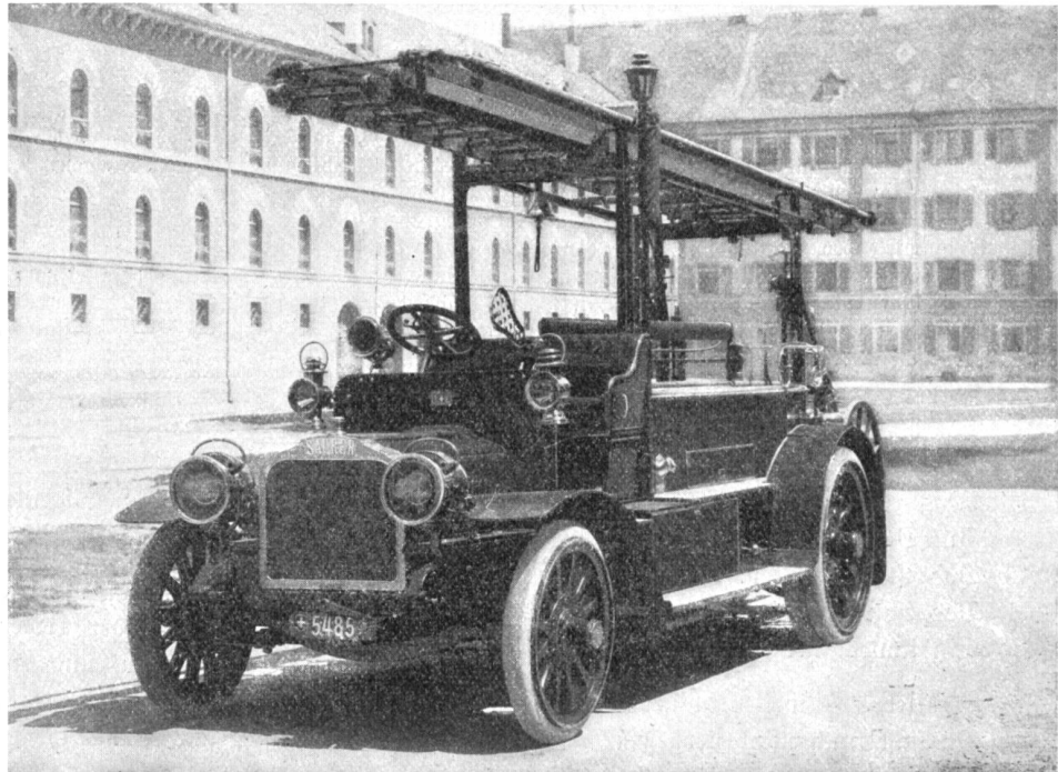
Automobilprüge (Cypus Saurer) und Feuerwehrdepot der Stadt St. Gallen.

Die eigentliche Heimat hat Luise's Tod gesehen auf Hohenzieritz, an ihrer Jugend hat sie keinen Teil. Ihr Vater, der spätere Herzog von Mecklenburg-Strelitz, residierte als Prinz Karl in Hannover, wo er, als Statthalter und Feldmarschall seines Schwagers von Großbritannien dessen kurfürstlich-hannoversche Armee befehligte. Da sie ihre Mutter, eine heftige Prinzessin, früh verloren, kam sie an den landgräflichen Hof von Darmstadt zur Großmutter, einer durch