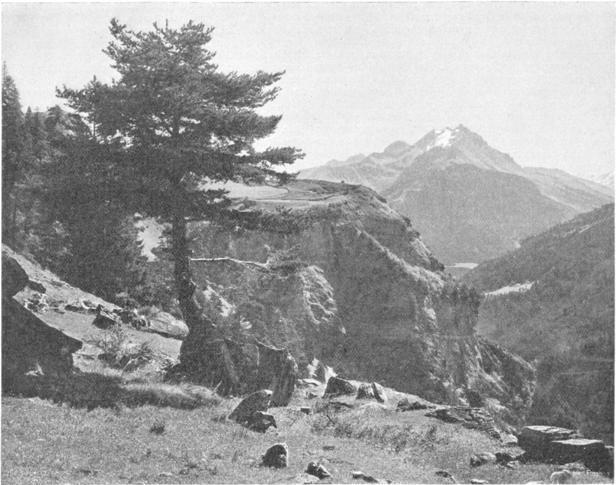
Alter Schyn. Bild auf Pic Mischel (3163 m).

Fraktion von Oberbaz, kommen, der Weg ab, der auf die Straße nach Solis oder nach Alvaschein-Tiefenkastel führt. Für die Rückkehr ins Domleschg empfiehlt sich die Besteigung des Mutterhornes und der Abstieg von da nach Zillis im Schamsertal, von wo aus man die Post durch die Biamala nach Thusis benutzen kann.