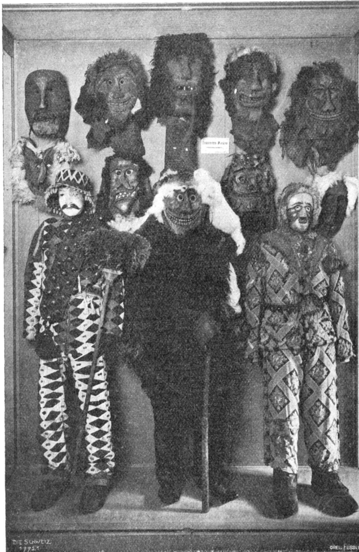
Volkskunde-Ausstellung Abb. 3. Schrank mit Fastnachtmasken. In der Mitte und oben die wilddämonischen Masken aus dem Walliser Lötschental, links ein „Legohr“ mit aufgenähten Fäden aus Aegeri, St. Zug, rechts ein „Märchler“ aus dem St. Schwyz.

da fühlte ich ihren Blick lächelnd auf meinem verträumten Gesicht ruhen . . .