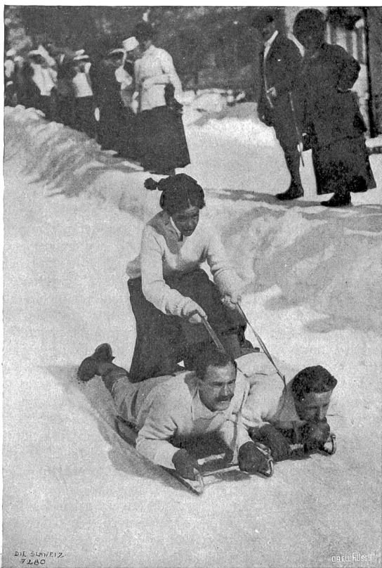
«Römlische Post» (St. Moritz), Phot. W. Schneider, Zürich.

An der Postroute Chur-Tiefencastel liegen in einem sonnigen Hochtal die insbesondere für den Skisport einzig dastehenden