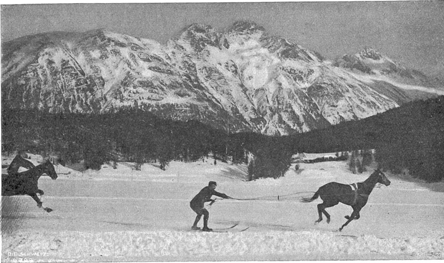
Ski-Kjöring in St. Moritz.

Station der Rhätischen Bahn. Fünf Hotels mit ca. 250 Betten.