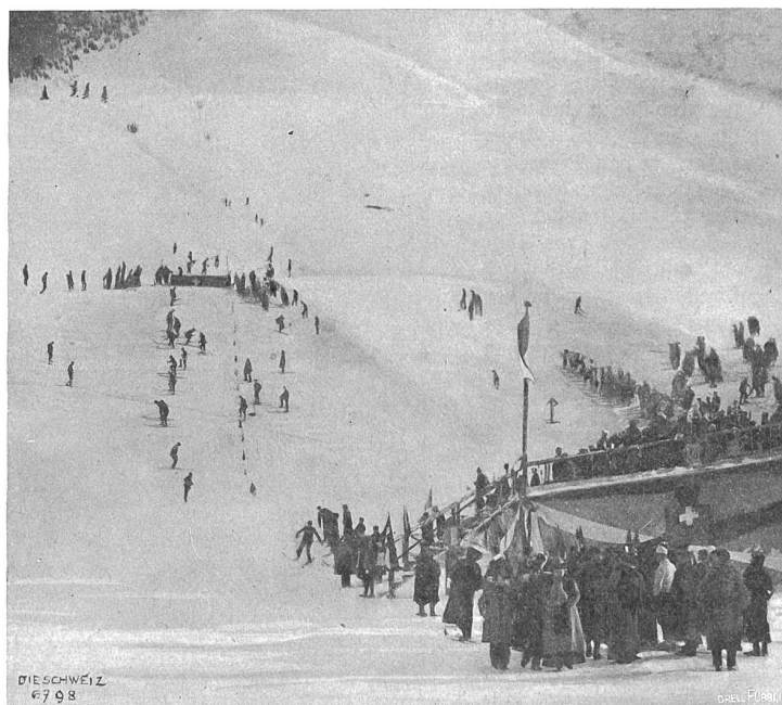
Skirennen in Andermatt.

Höhen der Oberalp, die leuchtenden Gipfel um den Gotthard und die ferne, schimmernde Furka. Der Ausblick auf die ringsum ragenden Schneeburgen weitet das Herz, die reine, starke Luft stählt den Körper.