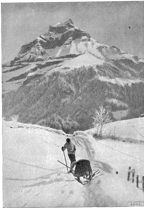
Der Bahnen bei Engelberg.

Inzwischen ist unser Bahnzug höher und höher gestiegen. Wir fragen uns, ob das frostige Nebelgewoge sich endlich lüften werde. Einige Fahrgäste werden ungeduldig und hüllen sich noch fester in ihre Wintermäntel ein. Da blinkt auf einmal ein Stückchen blauen Himmels wie eine trostreiche Verheißung, und noch ei-