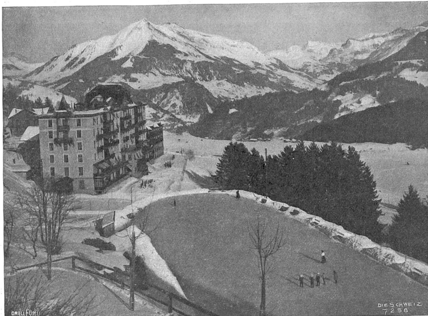
Keylin. Hotel und Eisfeld.

durch stark besucht sind. Der langen Winterseason, während der namentlich die Engländer als Besucher vorherrschen, folgt ein angenehmer Frühling, der speziell von deutschen Gästen bevorzugt wird. Dann kommt die Sommertouristen-Saison, während der Tausende von Fremden, allerdings nur für kurze Zeit, herbeiströmen, um Chillon zu sehen und die zahlreichen Ausflüge zu genießen, für die Montreux ein passendes Zentrum ist. Der Herbst bringt alsdann eine Menge eleganter französischer Besucher von Paris und andern Orten, wie auch eine große Anzahl solcher, die den Sommer auf den Bergen zugebracht haben und die Annehmlichkeiten von Montreux als Zwischenstation schätzen. Als Winteraufenthalt kann Montreux mit der Riviera verglichen werden. Es konkurriert in keiner Weise mit den andern schweizerischen Wintersportplätzen, die ihre Anziehungskraft alle auf einen Punkt basieren, die Bequemlichkeiten für Wintersport, für Schlittschuh, Ski, Bobsleigh und Luge; Montreux dagegen zieht seine Besucher durch sein mildes südliches Klima an, das es seiner außerordentlichen, vor jedem kalten Wind geschützten Lage verdankt. Hierzu kommen natürlich als weitere Annehmlichkeiten die Menge splendider erstklassiger Hotels und schöner Läden, der prächtige Kursaal mit seinem ausgezeichneten Voll-