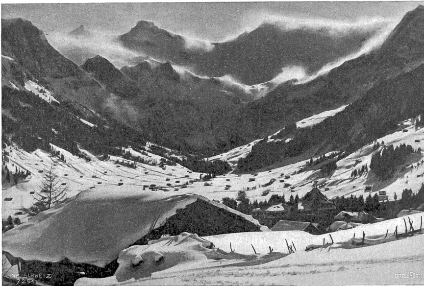
Adelboden im Winter. Blick auf den Wildstrubel.

Gehen erlernt habe, so gleiten die kleinen Knirpse den Abhang hinunter, die charakteristische Doppelspur mit ebensolchen „Kunfslöchern“ hinter sich lassend. Da kann man erleben, daß sich Groß und Klein, Einheimische wie Fremde an Wettläufen