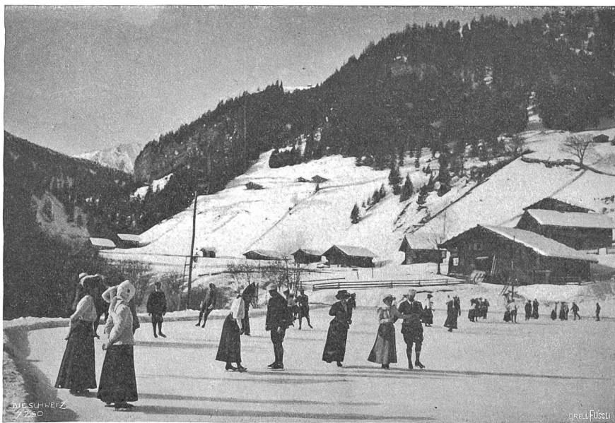
Eisbahn in Adelboden.

Die Sonne hat hier überall ungehinderten Zutritt und überflutet Tal und Berg mit ihren wärmenden Strahlen, den Spitzen jene Lichter aufsetzend, die sie diamantgleich in der trockenen, reinen Winterluft glitzern lassen. Die Sporttreibenden sind neben den Erholungsuchenden in großer Mehrzahl unter den Besuchern Adelbodens und stempeln so den Ort in erster Linie zum Wintersportplatz. Insbesondere ist es der Skisport, der hier ein äußerst günstiges Feld findet. Das Dorf selbst steht inmitten eines „Skifeldes“, eines Uebungsplatzes, und die übrige Talschaft mit den leicht erreichbaren Pässen, Höhenzügen und Gipfeln bietet dem Skifahrer die reichste Auswahl an leichten und schwierigen Touren. Adelboden pflegt seine sportlichen Einrichtungen mit peinlichster Sorgfalt; seine Eisplätze sind wie die Schlittelbahnen Musteranlagen. Kein Wunder! Denn der Einheimische selbst geht in seinen freien Stunden dem Sport nach, und fast möchte man glauben, daß die Jugend erst das Skilaufen und dann das